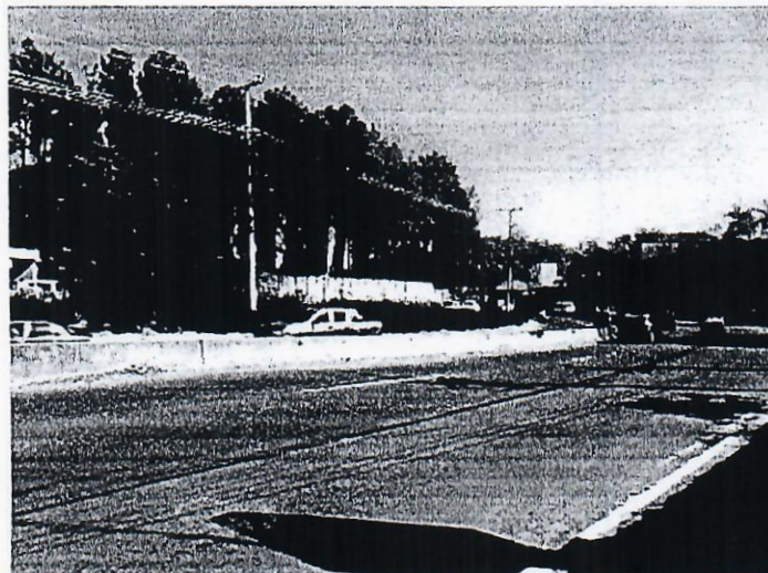
Carretera hacia San Salvador, lateral derecho sentido La Libertad-San Salvador.