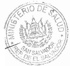
Dr a . Ana Del Carmen Orellana Bendek Ministra de Salud