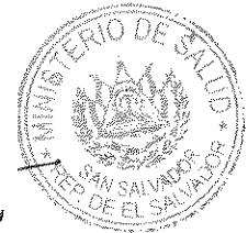
Dra. Ana Del Carmen Orellana Bendek Ministra de Salud