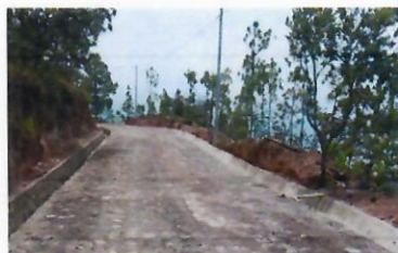
Antes y Después 12+350