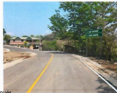
Antes y Después 3+477