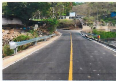
Antes y Después 0+500