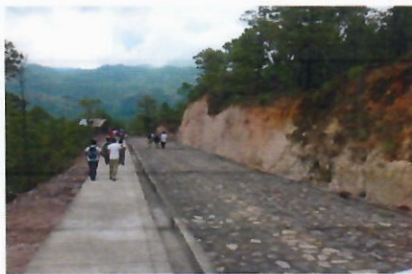
Antes y Después 9+850