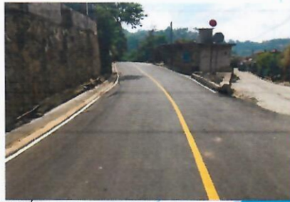
Antes y Después 0+500