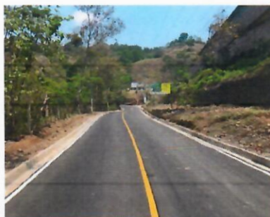
Antes y Después 0+400