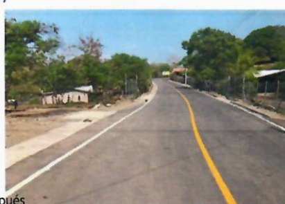
Antes y Después 4+700