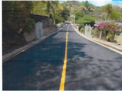
Antes y Después 0+400