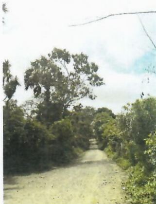
Entrada al Peñón