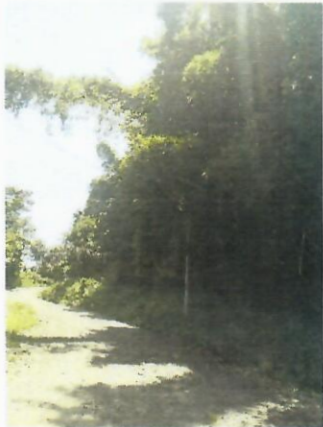
Caserío Los Cortez