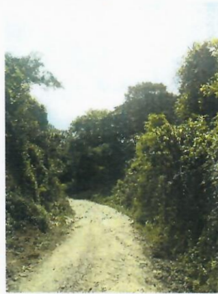
Cuesta El Guachipilín, hasta la reparación MOP