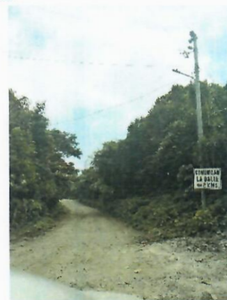
Comunidad La Dalia