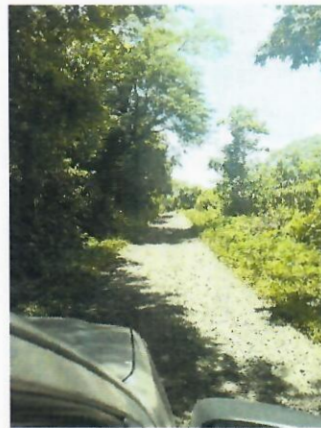
Plan del Coyol