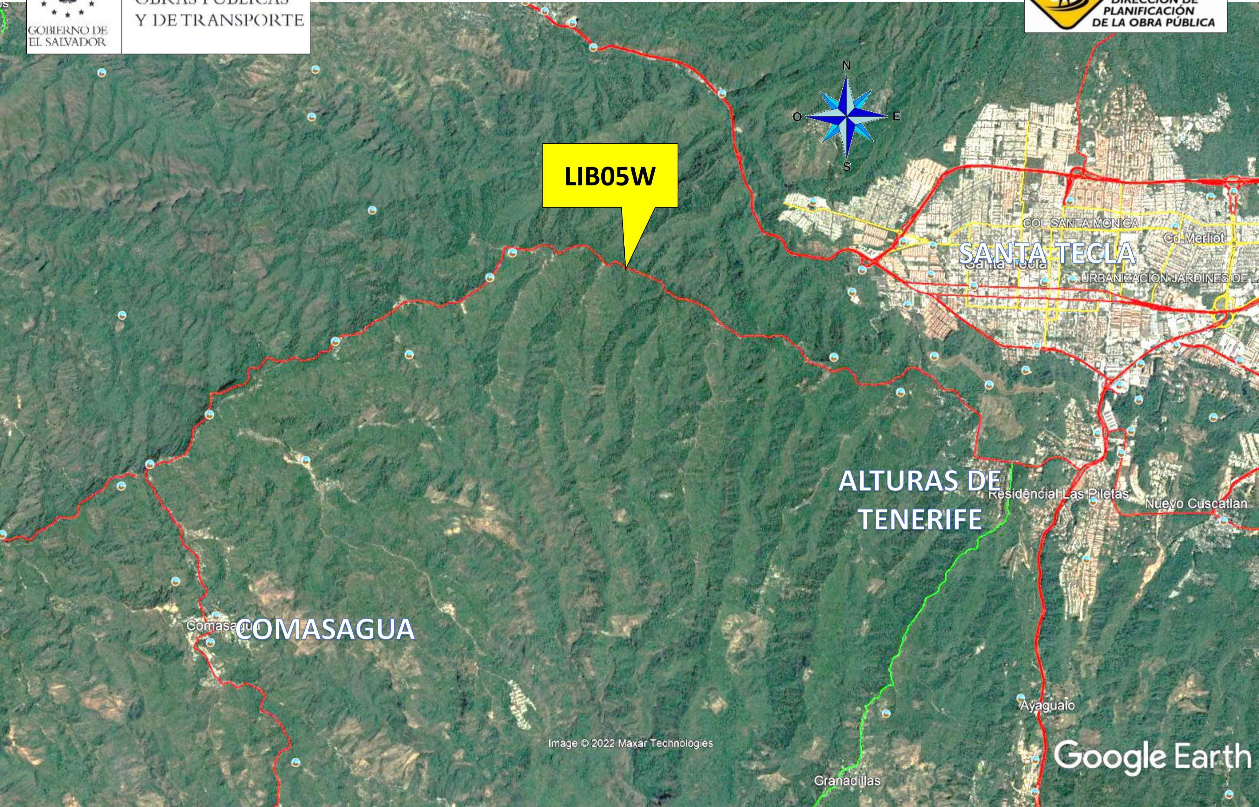
RUTA LIB05W, Tramo: CA04S - Dv. Comasagua (La Flecha) - Et. LIB22S, La Libertad. Clasificación: Terciaria Modificada