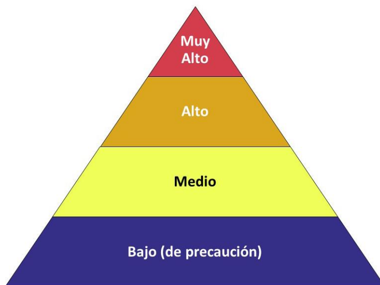
Figura G.1 - Pirámide de riesgos ocupacional para el COVID-19

La pirámide de riesgo ocupacional muestra los cuatro niveles de exposición al riesgo en la forma de una pirámide para representar la distribución probable del riesgo.