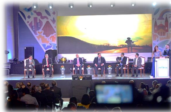
Autoridades del Ministerio de Turismo, Ministerio de Economía, Ministerio de Relaciones Exteriores, Secretaría Técnica y de Planificación de la Presidencia, Secretaría de Comunicaciones de la Presidencia y PROESA lanzan la Marca País “El Salvador, Grande como su gente”. 28 de marzo 2017.