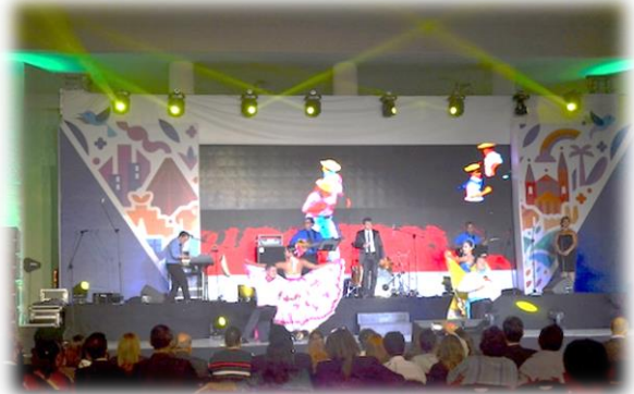
Presentación artística a cargo del Maestro Álvaro Torres, 28 marzo 2017.