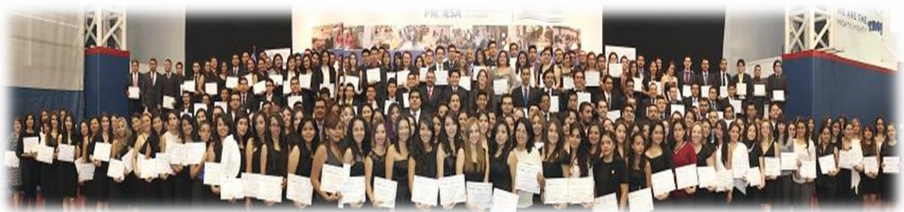
Segunda graduación del Programa Triunfa Mejorando tu inglés, Agosto 2014.