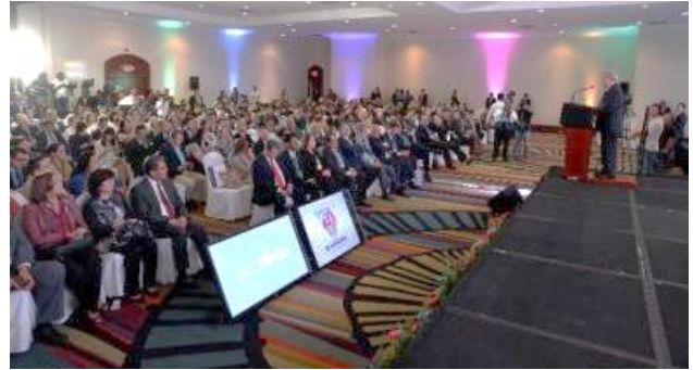
Palabras de inauguración por parte del Presidente de la República, Profesor Salvador Sánchez Cerén.