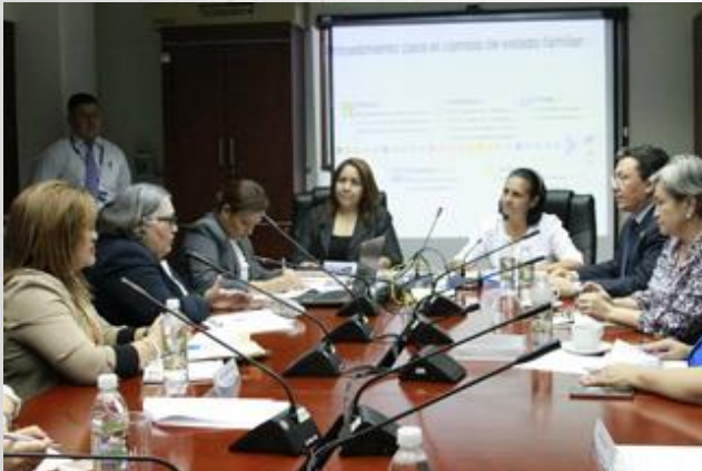
Comisión de la Mujer y Género de la Asamblea Legislativa