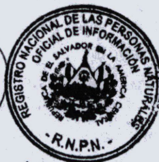
Óscar Ernesto Aguilar Crespín Oficial de Información RNPN