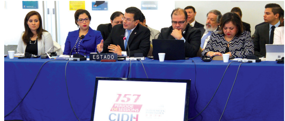
En representación del Gobierno de El Salvador, el ministro de la Relaciones Exteriores, Hugo Martínez, asistió al 157 período de sesiones en la sede de la Comisión Interamericana de Derechos Humanos en Washington D.C. Estados Unidos.

En abril de 2016, el ministro de Relaciones Exteriores, Hugo Martínez, presidió la comitiva del Gobierno de El Salvador que asistió al 157 período de sesiones en la sede de la CIDH en