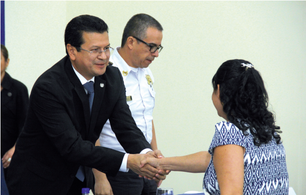
El Gobierno salvadoreño, a través del Ministerio de Relaciones Exteriores, lanzó oficialmente el Programa de becas para hijos e hijas de agentes de la Policía Nacional Civil caídos en el cumplimiento del deber o a causa del servicio.