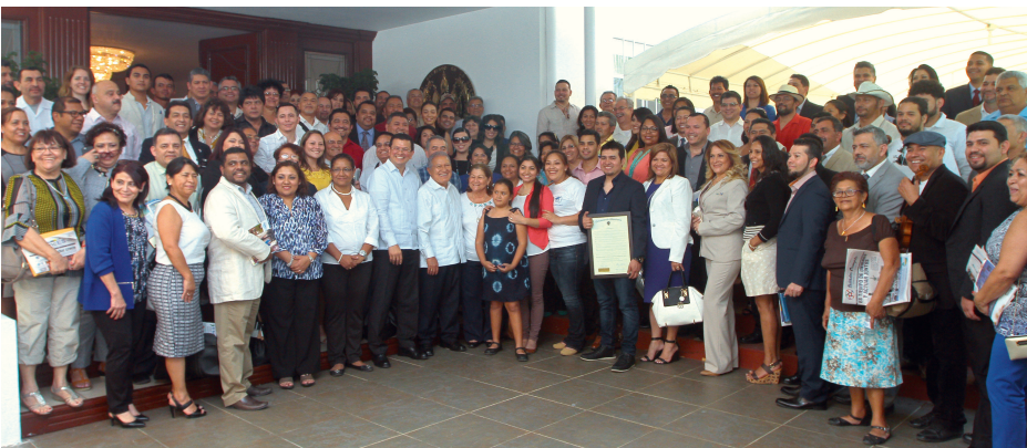
Cancillería coordinó el “Encuentro Gubernamental con Organizaciones de Salvadoreños en el Exterior” en el que participaron más de 120 connacionales provenientes de países de Norte América, Centroamérica y Europa.

El 15 de enero de 2016, se realizó el relanzamiento del Consulado General de El Salvador en Choluteca, Honduras, cuyas instalaciones fueron remodeladas para la comodidad de los compatriotas usuarios. Asimismo, el 17 de enero, fueron inauguradas las nuevas instalaciones del Consulado General de El Salvador en Houston, Texas, Estados Unidos.