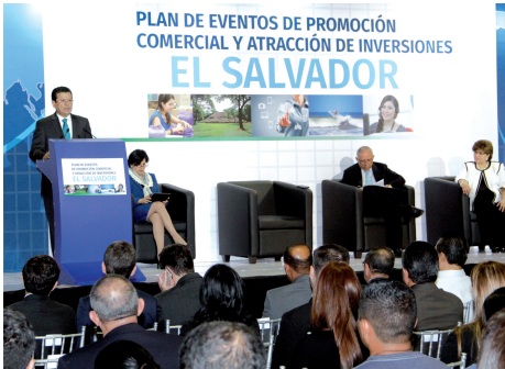
El ministro de Relaciones Exteriores, Hugo Martínez, presidió el evento de presentación del "Plan de Eventos de Promoción Comercial y Atracción de Inversiones El Salvador 2016".

resultados en cuanto a visitas de negocios y han contribuido a facilitar tratos comerciales.