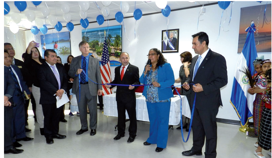
La viceministra Magarín presidió la inauguración de las nuevas instalaciones del consulado general de El Salvador en Houston, Texas, en Estados Unidos.

Para dar continuidad a los compromisos adquiridos con la diáspora durante dicho espacio, la Cancillería elaboró una hoja de ruta en