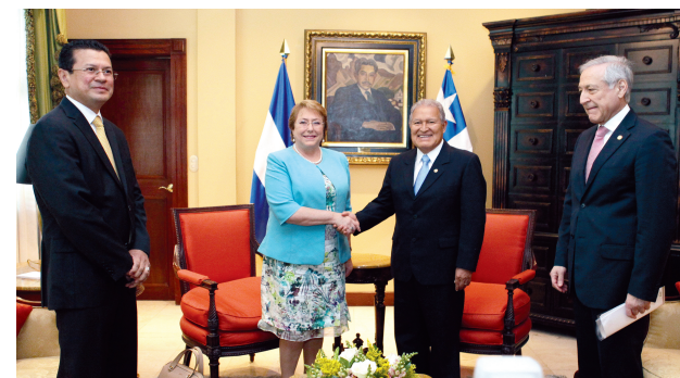
El Salvador recibió la visita oficial de la presidenta de Chile, Michelle Bachelet, con quien se fortalecieron los lazos que unen ambas naciones.