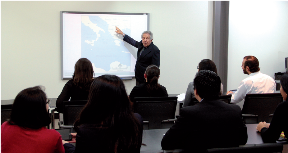
El IEESFORD inició con la tercera Cohorte de estudiantes de la Maestría en Diplomacia.

Formación Diplomática (IEESFORD) benefició a 162 personas con los siguientes cursos: