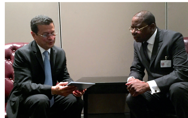
El Salvador estableció lazos diplomáticos con Senegal