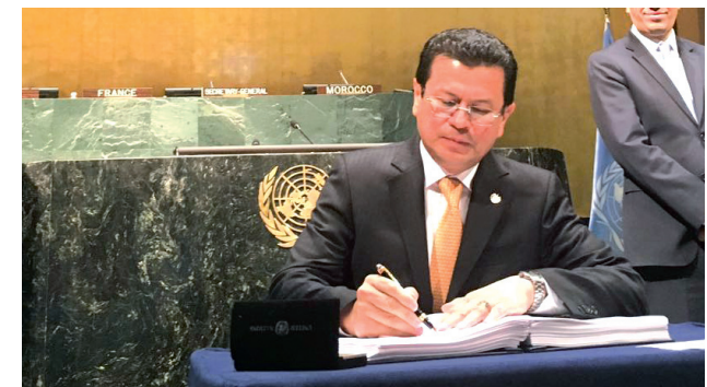
El 22 de febrero de 2016, El Salvador ratificó su respaldo al Acuerdo de París sobre Cambio Climático, surgido en la COP21.