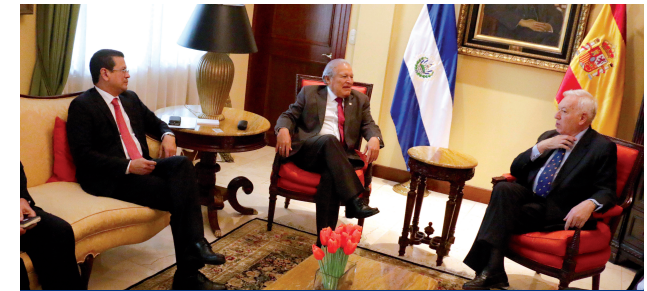
El presidente Sánchez Cerén recibió en Casa presidencial al ministro de Asuntos Exteriores y Cooperación español, José Manuel García Margallo.

Del 25 al 27 de septiembre de 2015, El Salvador participó en la Cumbre de las Naciones Unidas para el Desarrollo Sostenible celebrada en Nueva York,