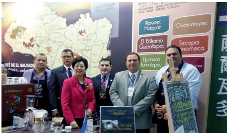
El Salvador estuvo presente en la Feria de Té, Café y Vino realizada en la República de China (Taiwán).