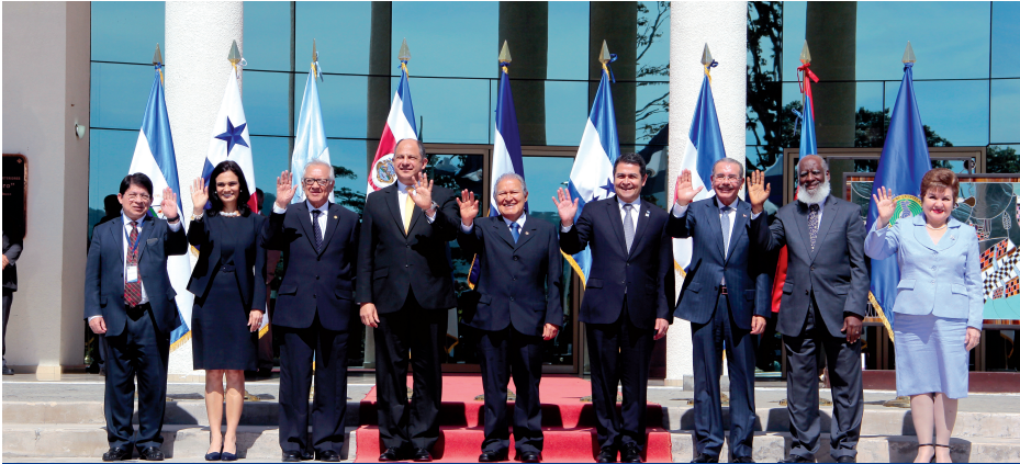
El Salvador acogió la XLVI Cumbre de Jefes de Estado y de Gobierno del SICA, donde se presentaron los logros alcanzados en la PPT-SICA El Salvador 2015.