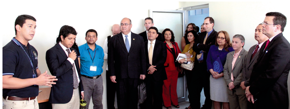
El ministro de Relaciones Exteriores, Hugo Martínez, participó en la inauguración de las obras de reconstrucción y equipamiento de la Dirección de Atención al Migrante, adscrita a la Dirección General de Migración y Extranjería, ubicada en la Colonia Quiñonez de San Salvador. La obra fue realizada por la Organización Internacional para las Migraciones (OIM), con fondos de la Agencia de los Estados Unidos para el Desarrollo (USAID).

Este proyecto piloto se ha instalado en las gobernaciones de Santa Ana, Chalatenango, San Salvador, Usulután y San Miguel, así como en los centros de atención del migrante en el Aeropuerto Internacional “Monseñor Oscar Arnulfo Romero y Galdámez” y el Centro de Atención para Repatriados (CAR), ubicado en la colonia Quiñonez, en San Salvador.