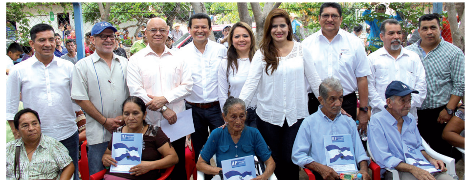
El Gobierno de El Salvador, a través de la Comisión de Seguimiento El Salvador-Honduras, por medio de la sección nacional, en coordinación con el Instituto de Legalización de la Propiedad (ILP) y el Centro Nacional de Registros (CNR), entregó 200 títulos de propiedad a pobladores del sector bajo de Nahuaterique, caserío "La Laguna", municipio de San Antonio del Mosco, departamento de San Miguel.