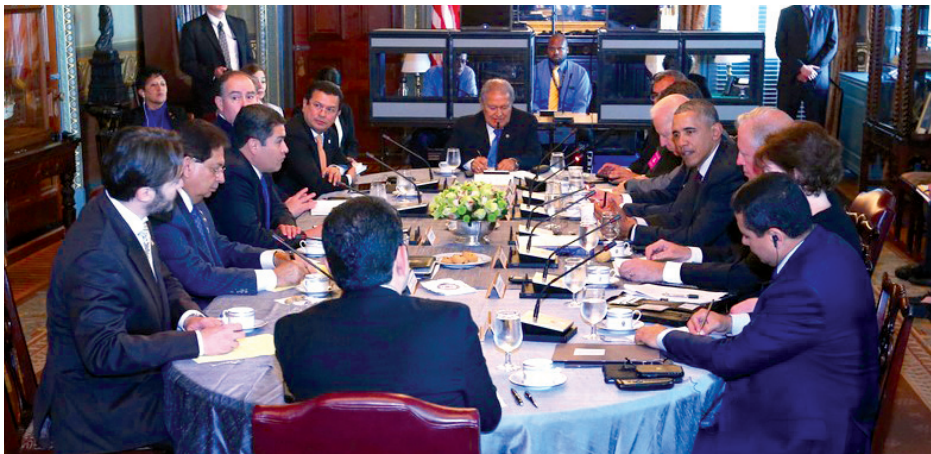
El presidente Salvador Sánchez Cerén asistió a la reunión de mandatarios del Triángulo Norte con el presidente y el vicepresidente de Estados Unidos, Barack Obama y Joseph Biden, respectivamente, para avanzar en la implementación del Plan de la Alianza para la Prosperidad.

A este recurso se suman los 750 millones de dólares que el Congreso de Estados Unidos aprobó a petición del gobierno del presidente Barack Obama para el 2016, junto con 500 millones de dólares adicionales que reorientará para este fin.