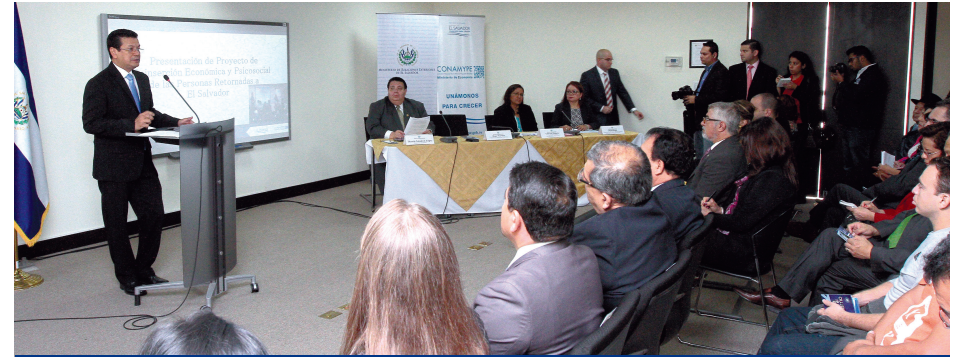
El Gobierno de El Salvador, a través del Ministerio de Relaciones Exteriores, presentó el Programa Integral de Reinserción a Personas Retornadas, así como el Proyecto de Reinserción Económica y Psicosocial que desarrollará junto con la Comisión Nacional de la Micro y Pequeña Empresa (Conamype).

El 14 de septiembre de 2015, el Ministerio de Relaciones Exteriores presentó el Programa Integral de Reinserción a Personas Retornadas, así como el Proyecto de Reinserción Económica y Psicosocial a desarrollarse junto con la Comisión Nacional de la Micro y Pequeña Empresa (Conamype).