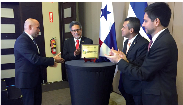
El 8 de marzo de 2016 se inauguró la Consejería Económica, Comercial y de Turismo de Panamá.