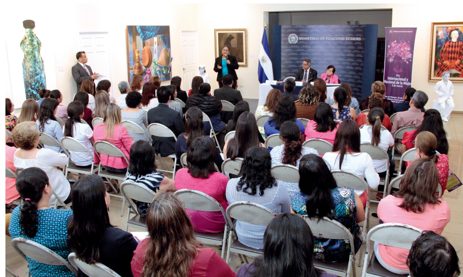
Cancillería realizó la Feria de la Mujer, en el marco de la conmemoración del Día Nacional e Internacional de la Mujer.

El 11 de marzo de 2016, en el marco de la conmemoración del Día Nacional e Internacional de la Mujer, se llevó a cabo en la sede del Ministerio la "Feria de la Mujer", que contó con la participación de mujeres emprendedoras y de diversas instituciones del Estado y de organizaciones sociales que trabajan en favor de sus derechos.