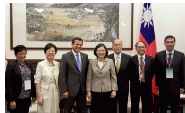
El canciller Hugo Martínez se reunió con la presidenta de la República de China (Taiwán), Tsai Ing-wen, durante la toma de posesión de su mandato.