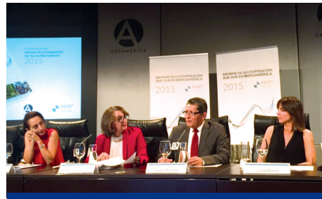
El viceministro Miranda presentó en España el informe de Cooperación Sur – Sur de Iberoamérica 2015, en el marco del encuentro de la SEGIB y el Programa Iberoamericano para el Fortalecimiento de la Cooperación Sur – Sur.