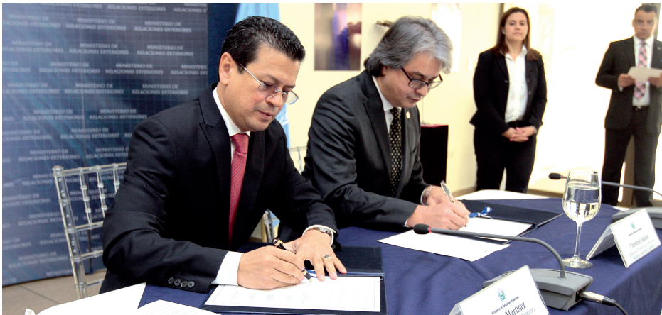
El Salvador y el Sistema de Naciones Unidas firmaron un acuerdo de trabajo conjunto para la implementación de la Agenda de Desarrollo Sostenible 2030.

Naciones Unidas para el Desarrollo Sostenible en Nueva York, Estados Unidos y la Cumbre de Cambio Climático, en París, Francia.