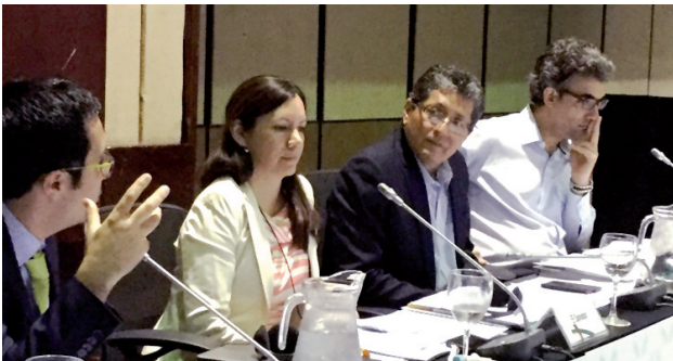
El Salvador participó en la reunión del Comité Técnico Intergubernamental del Programa Iberoamericano para el Fortalecimiento de la Cooperación Sur-Sur (PIFCSS), realizada en Cartagena de Indias, Colombia.