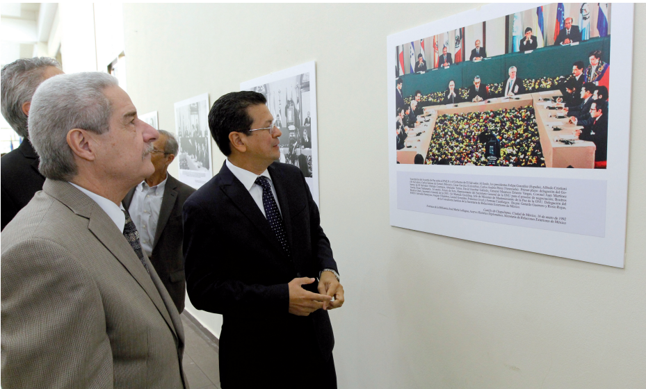
El Ministerio de Relaciones Exteriores, a través de la Oficina de Asuntos Culturales, genera espacios de promoción cultural en los que participan artistas de origen nacional y del exterior. De esta manera, ha realizado exposiciones como "Imágenes del Camino hacia la Paz".

De igual forma, se ha apoyado la promoción de arte escultórico y la pintura, tanto en la sede como en el exterior, entre otras demostraciones culturales de la amplia gama en la que incursionan nuestros artistas nacionales, quienes continúan destacando por su gran capacidad, dominio de las técnicas de vanguardia y posibilidades de posicionamiento internacional.