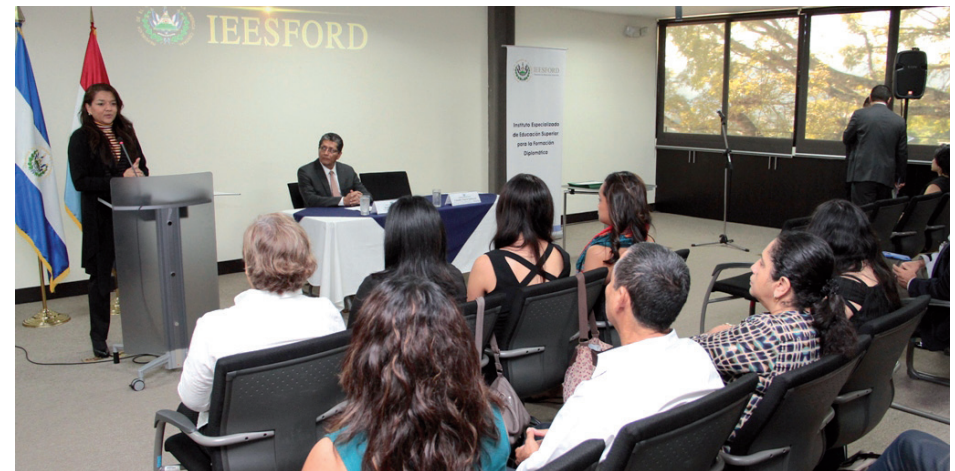
El viceministro Jaime Miranda, presidió el acto de clausura del Diplomado sobre Cooperación para el Desarrollo, dirigido a Organizaciones de la sociedad civil representadas en el Movimiento de Organizaciones no Gubernamentales para el Desarrollo Solidario de El Salvador (MODES) y el Foro de Organizaciones de Cooperación Internacional Solidaria (FOCIS).

Los cursos en modalidad no presencial, han beneficiado a 64 personas, 10 de la sede y 54 del servicio exterior.