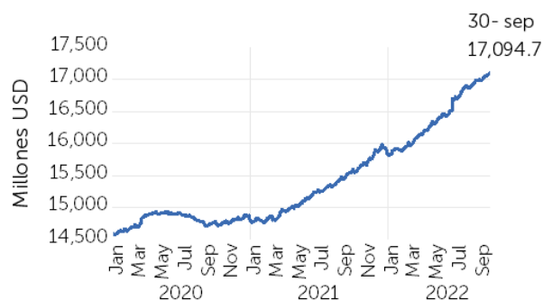
Gráfico 1. Evolución de préstamos

Al 30 de septiembre del 2022, los préstamos brutos de los bancos, bancos cooperativos y sociedades de ahorro y crédito (SAC) totalizaron USD 17,094.7 millones, reflejando un crecimiento interanual de USD 1,493.5 millones, equivalente a 9.6%