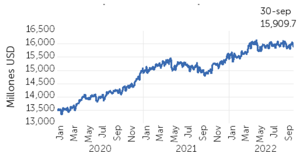
Gráfico 3. Depósitos del sector privado

“Los depósitos de bancos, bancos cooperativos y SAC representan un 90.9% del total de las fuentes de fondeo”