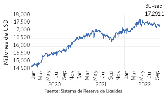
Gráfico 2. Evolución de depósitos

Los depósitos privados registraron un saldo de USD 15,909.7 millones, manteniendo la tendencia estable, mientras, los depósitos públicos muestran un saldo de USD 1,381.4 millones, experimentando una tendencia a la baja a partir de mayo 2022, retornando a los valores previos a la inyección de recursos para atender los efectos de la pandemia durante 2020 y 2021