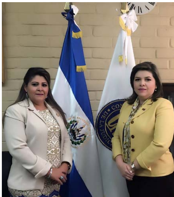
Presidenta del CNJ recibe a Directora General UTE que le presentará sus proyecciones de trabajo desde su nueva gestión

Se realizaron 3 reuniones de trabajo del Comité para trabajar la línea gráfica y mecanismos de divulgación de la misma.