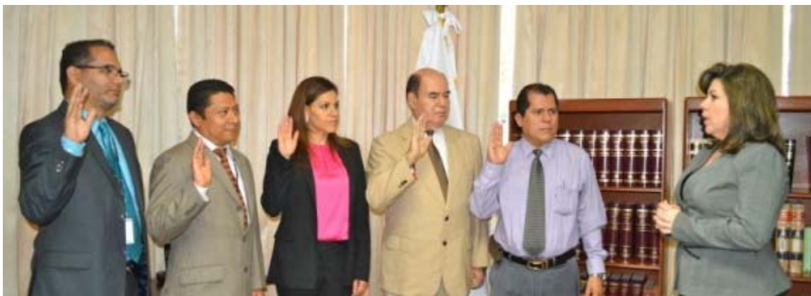
Juramentación de la Comisión de actualización de normativa institucional

Producto de ello los miembros de dicha comisión han sostenidos diversas reuniones con el objeto de revisar y actualizar la normativa administrativa establecida a nivel institucional.