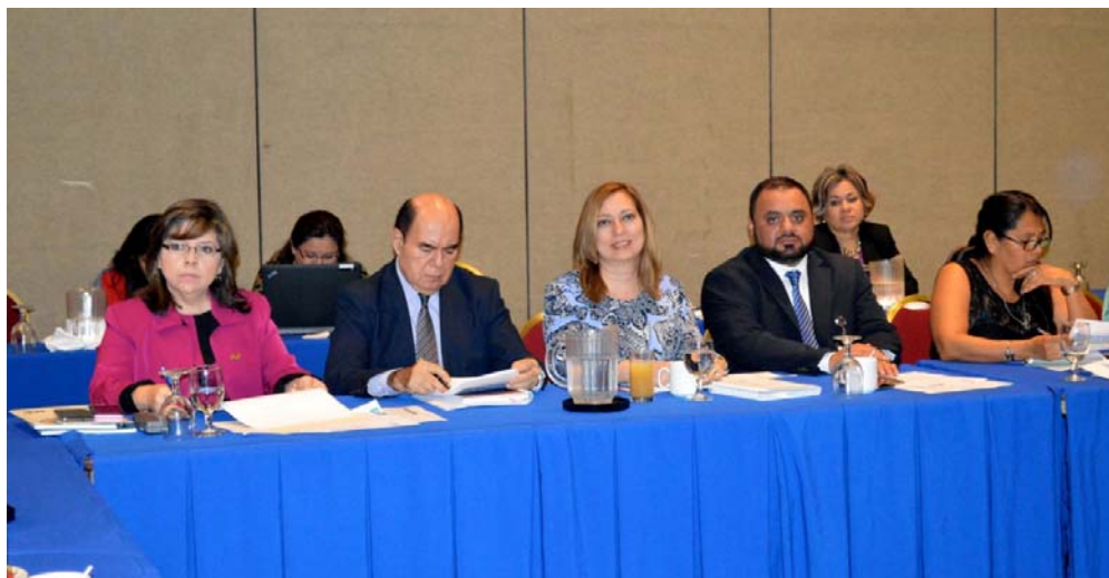
Consejo Nacional de Seguridad Ciudadana y Convivencia Social