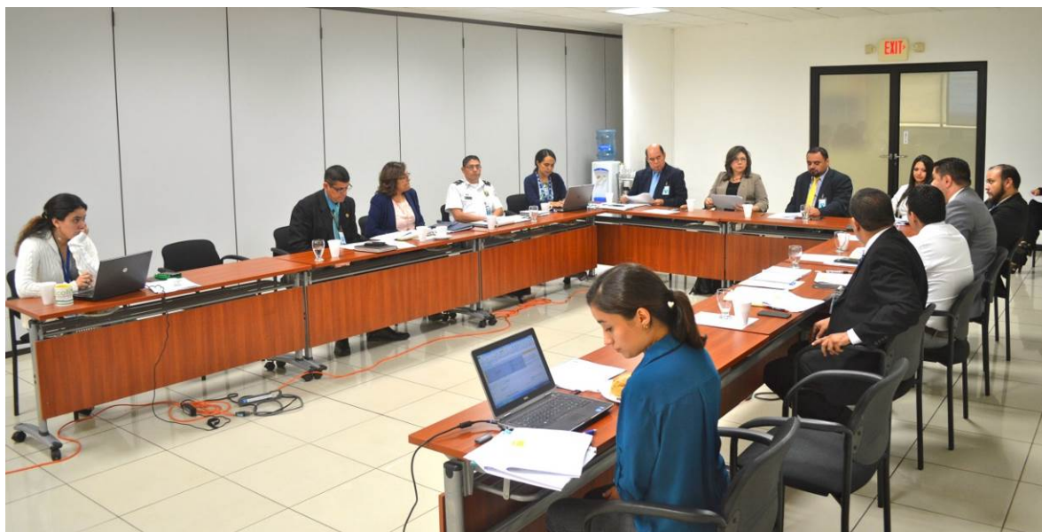
Taller de trabajo con representantes de las instituciones del Sector de Justicia para revisión de indicadores de monitoreo del PESS

Asimismo, se brindó apoyo al Programa de las Naciones Unidas para el Desarrollo (PNUD), para gestionar con representantes de las instituciones del Sector de Justicia, la revisión y validación de los indicadores de monitoreo establecidos del PESS, que permitan brindar seguimiento a la ejecución de las acciones programadas en éste.