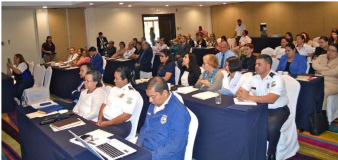
Evento de inauguración del Diplomado "Acceso a la Justicia y a la Salud sin Estigma y Discriminación"