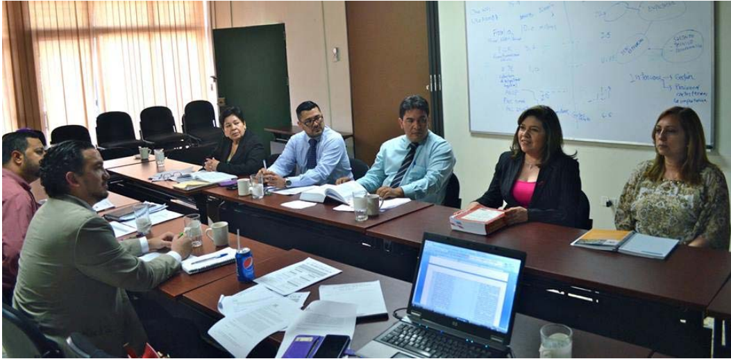
Comité Directivo Interinstitucional Expedientes Legislativos