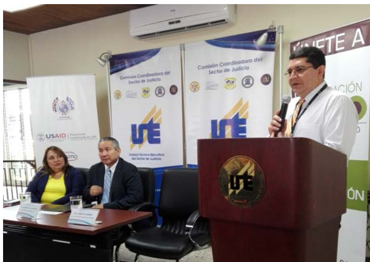
Evento de acreditación de la UTE como Zona Cero

Dicha acreditación se otorgó como resultado de la finalización un proceso de sensibilización dirigido al personal de la institución y la elaboración del Programa Anual del VIH, el cual tuvo el acompañamiento de médicos del Ministerio de Salud.