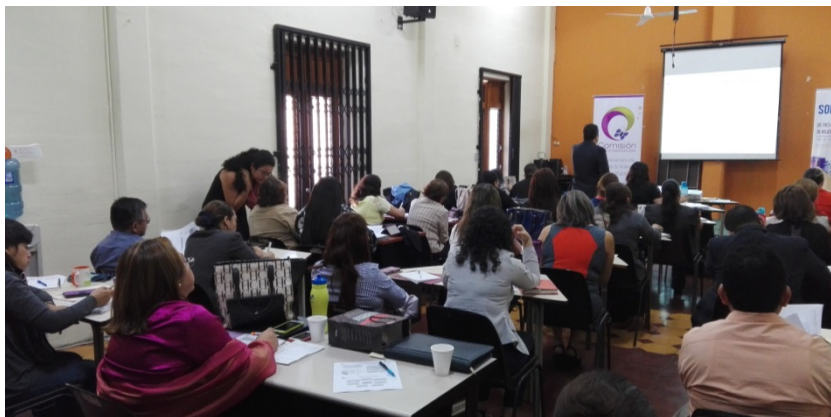
Procesos sancionatorios en casos de violencia contra la mujer / ISDEMU