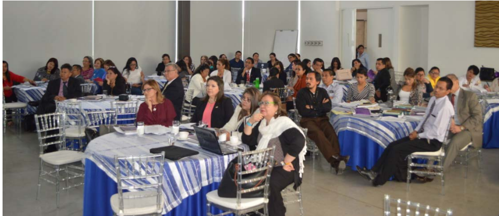
Mesas de Trabajo de la Jurisdicción Especializada de los Nuevos Tribunales de la Mujer