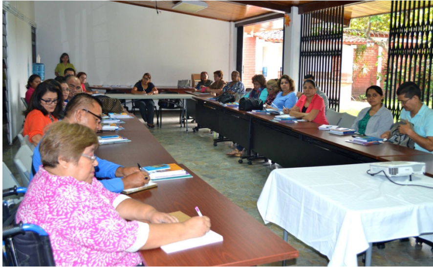
Capacitación sobre el que hacer de las instituciones del Sector de Justicia en el marco del Programa de Educación Legal Popular dirigido a los maestros de las escuelas Centro Escolar Griselda Zeledón, Centro Escolar Mercedes Quinteros, Centro Escolar Constitución 1950, Centro Escolar Salvador Mugdan