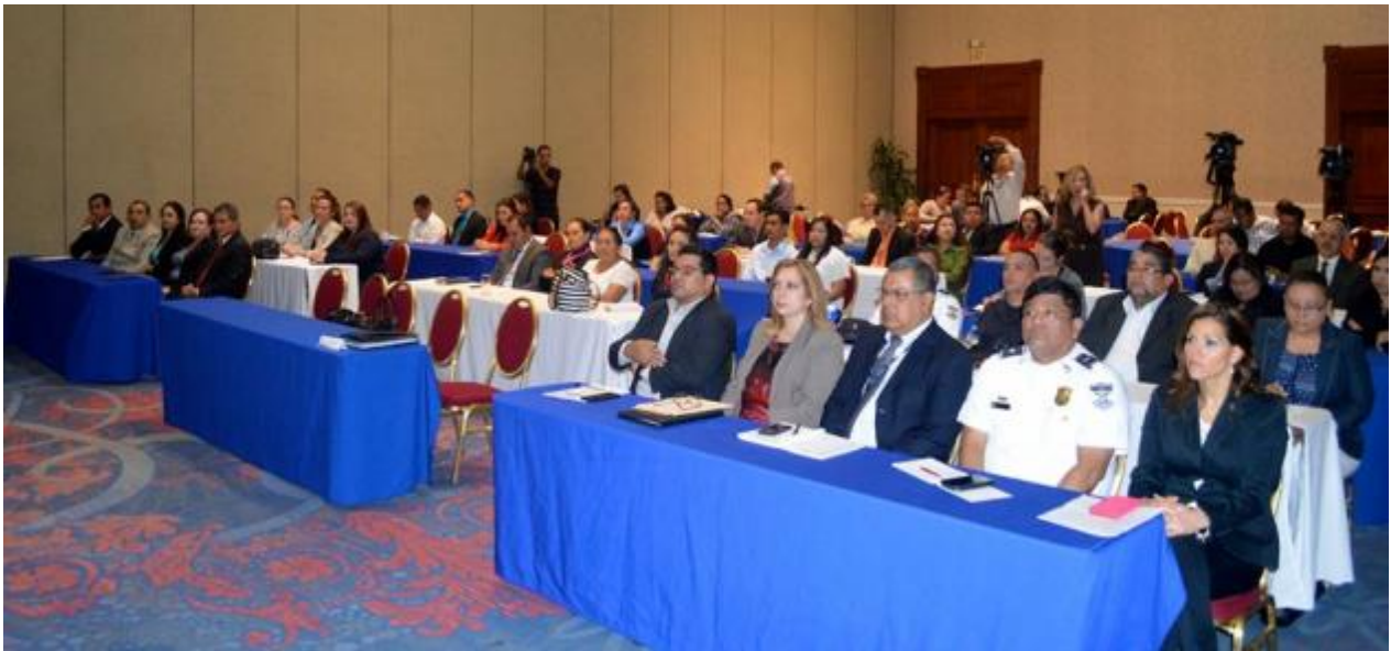
Funcionarios de la UTE participan en primer encuentro para analizar Justicia Penal Juvenil