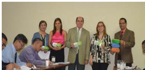
Encuesta y entrega de afiches de ética al personal institucional

Producto de estas acciones, se elaboró el Plan de Trabajo de la Comisión de Ética de la institución para el año 2017, el cual fue presentado a la Dirección General y al Tribunal de Ética Gubernamental.