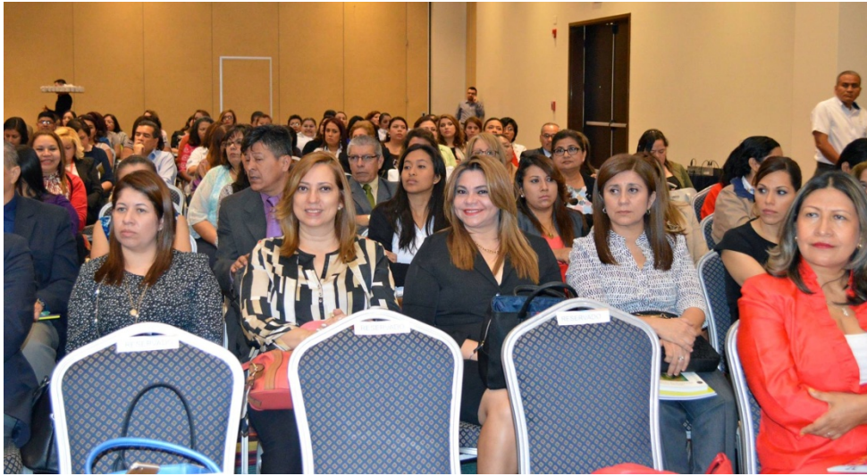
Conmemoración a la Mujer para una vida libre de violencia