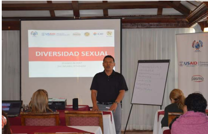
Capacitación sobre diversidad sexual (PASMO – USAID)