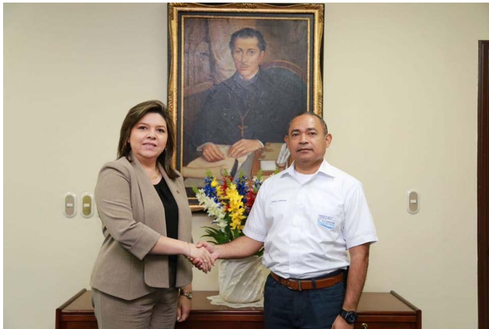
Ministro de Justicia y Seguridad Pública recibió en su despacho a Directora General de UTE quien le presentó sus propuestas de trabajo desde la nueva gestión