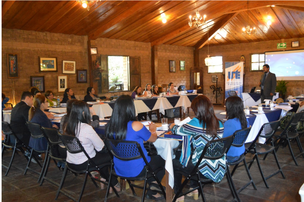
Talleres sobre validación del Documento Reparación por Daños a Víctimas de Violencia Sexual