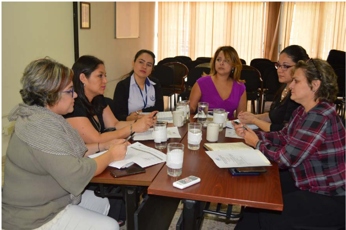
Reuniones ordinarias del Comité Directivo Interinstitucional de Comunicadores del Sector de Justicia