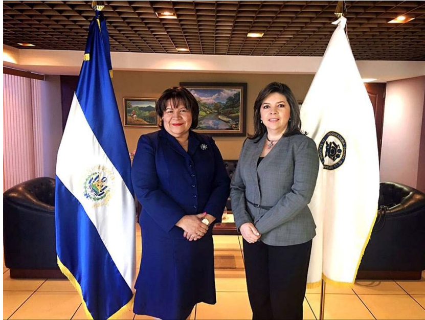
Procuradora General de la República recibió en su despacho a Directora General de UTE que presentó las proyecciones de trabajo desde su nueva gestión.