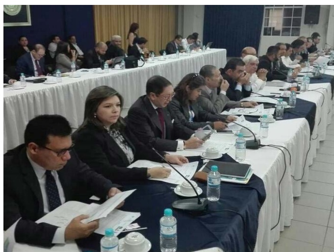
Participación de funcionarios de la UTE en reuniones del Pleno del CNSCC y de la Comisión de Seguimiento y Articulación