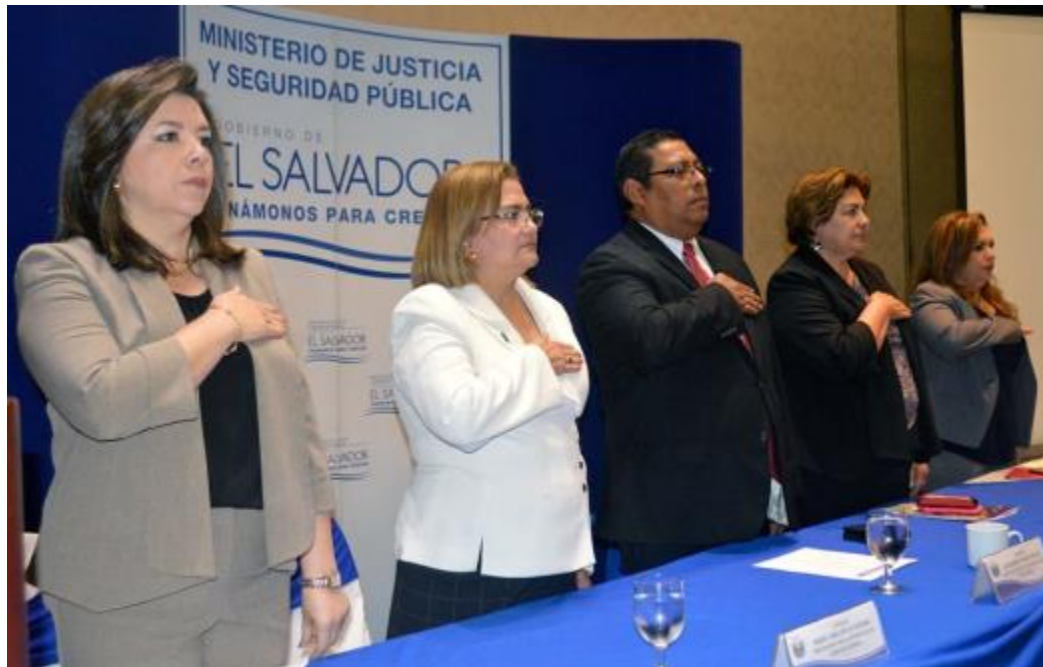
Primer encuentro para analizar Justicia Penal Juvenil