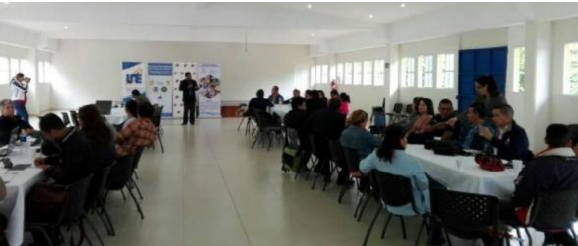
Desarrollo del Segundo encuentro regional de la Mesa Interinstitucional de Justicia Penal Juvenil con población operativa del occidente del país