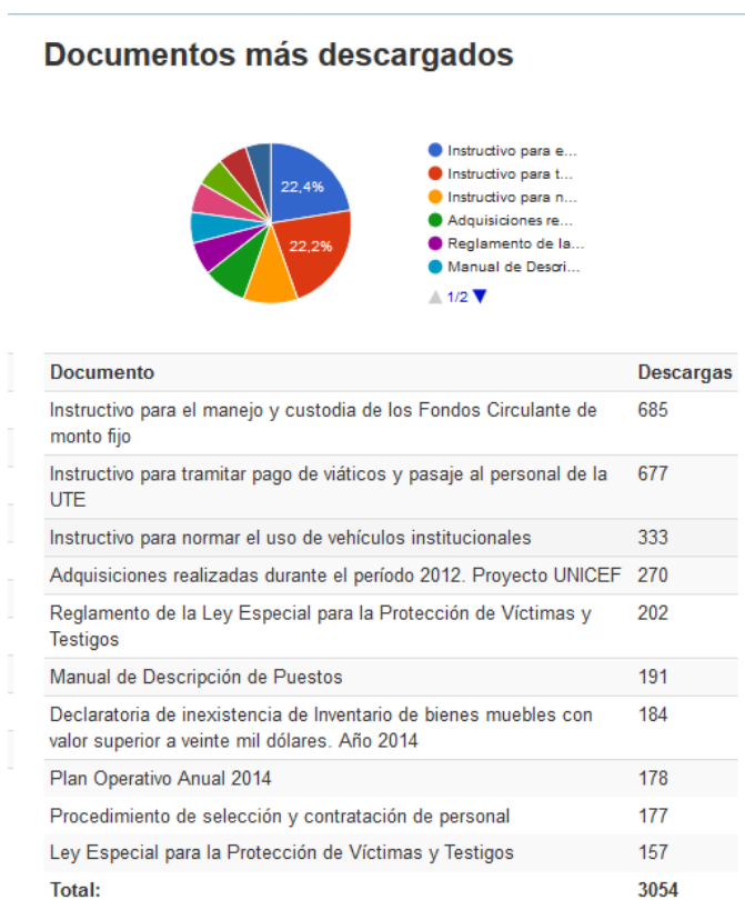
Cuadro No. 1 Documentos con mayor número de descargas en el portal de transparencia institucional.

En relación a los tres documentos que registran un mayor número de descargas, se observa de acuerdo al cuadro anterior, que el documento con mayor número de descargas es el Instructivo para el manejo y custodia de los Fondos Circulante de monto fijo, con 685 descargas, equivalentes a un 22.43% del total; seguido del Instructivo para tramitar pago de viáticos y pasaje al personal de la UTE, con 677 descargas, que corresponden a un 22.16% del total; así como por el Instructivo para normar el uso de vehículos institucionales con 333 descargas, equivalentes a un 10.90% del total.