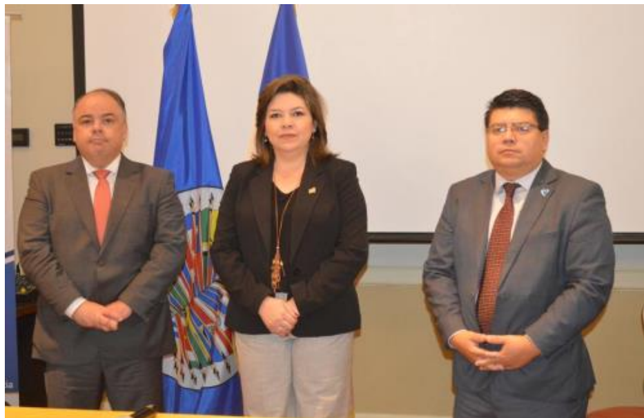
UTE y OEA realizan taller sobre la investigación de delitos relacionados a la migración irregular, en el que participan jueces, procuradores, fiscales y policías.