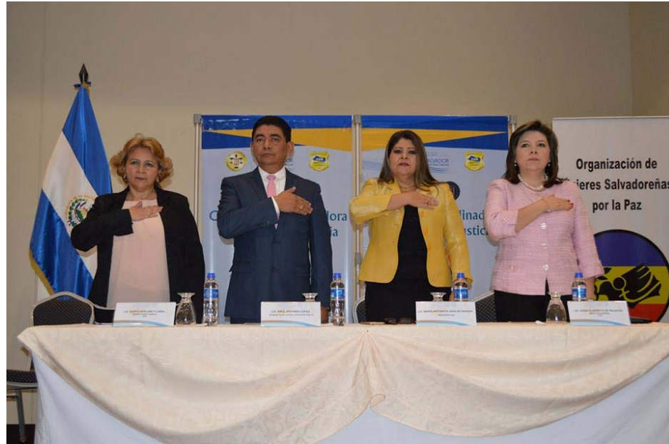
Evento conmemorativo del Día Internacional De La Mujer: “Por Una Vida Libre De Violencia y Discriminación para las Mujeres”