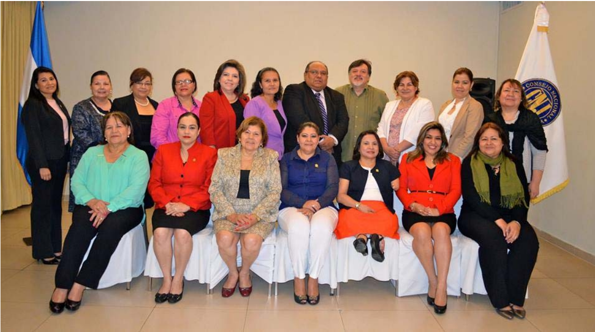
Encuentro Binacional de Mujeres de los más Altos Órganos de Justicia de El Salvador, organizado por el Consejo Nacional de la Judicatura.