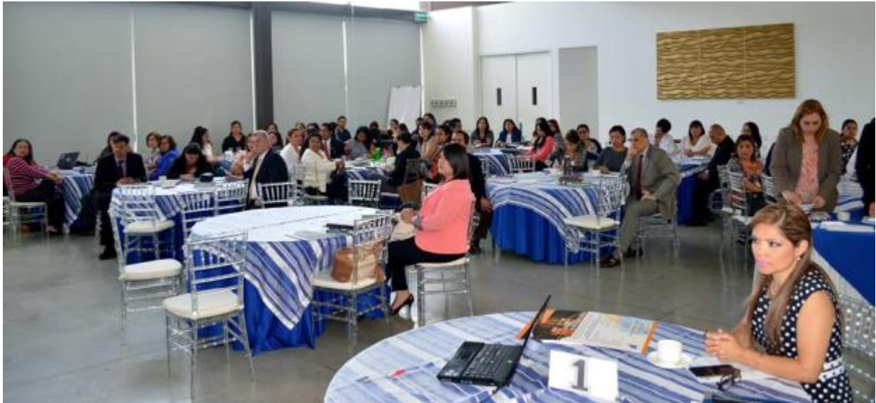
UTE participa en taller “Análisis sobre el alcance de la competencia y otros aspectos complementarios para la implementación de los Tribunales de la Jurisdicción Especializada de la Mujer”.