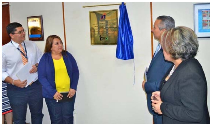
La Unidad Técnica Ejecutiva del Sector de Justicia (UTE) se convierte en "zona cero" libre de estigma y discriminación