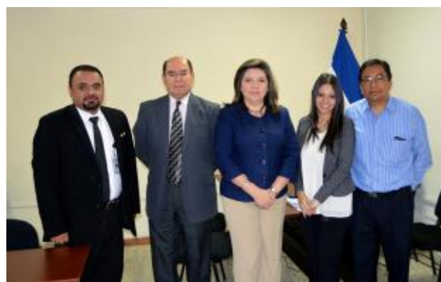
Reunión de trabajo con miembros del Comité Directivo Interinstitucional conformado para elaborar el Plan de Acción del Sector de Justicia sobre las metas priorizadas del PESS