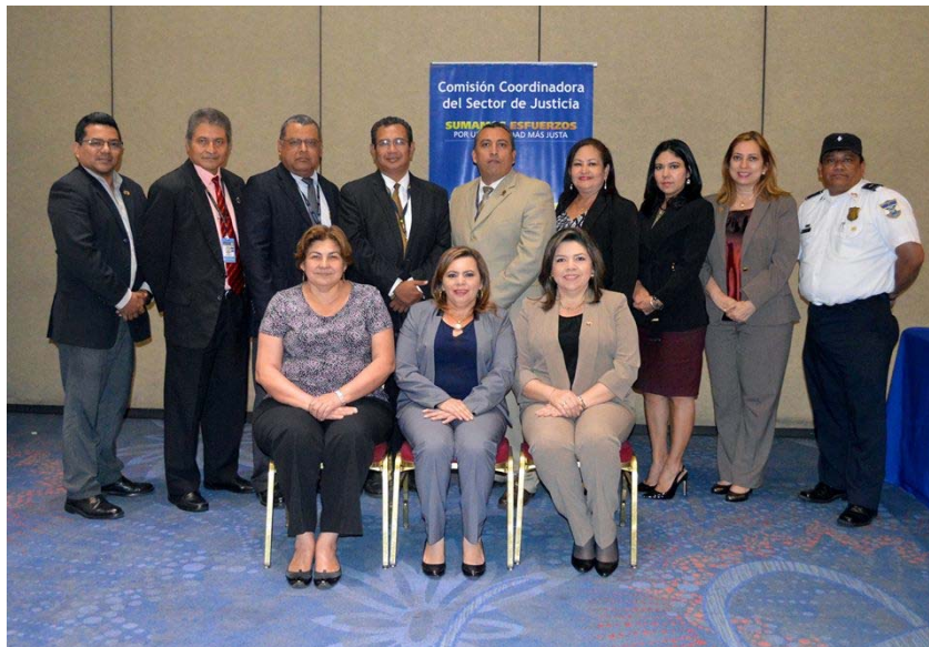
Mesa interinstitucional especializada en materia Penal Juvenil