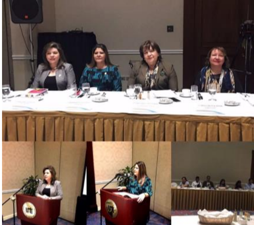
Comisión Coordinadora del Sector de Justicia y UTE desarrollan evento informativo sobre tribunales especializados para una vida libre de violencia y discriminación para mujeres dirigido a periodistas.