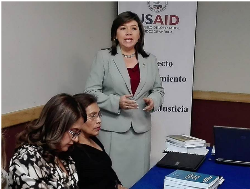
Taller sobre evaluación de la aplicación del Código Procesal Penal con la Procuraduría General de la República