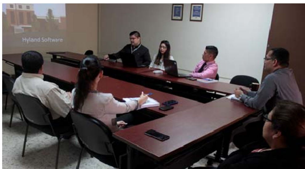
Reunión con empresa proveedora de sistemas informáticos

Con el objeto de volver más eficientes los procesos de administración y gestión documental, mediante la implementación del Sistema Integrado Institucional, se sostuvieron reuniones con diferentes empresas proveedoras de sistemas de información que permiten la automatización de procesos gerenciales, a efecto de evaluar los beneficios que ofrecen cada una de ellas y analizar la factibilidad de implementación a nivel institucional.