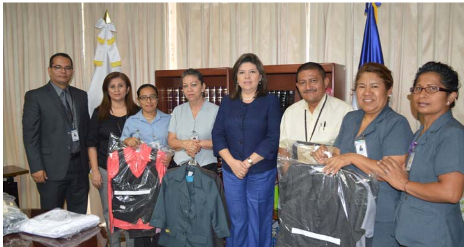
Entrega de uniformes por parte de la Dirección General