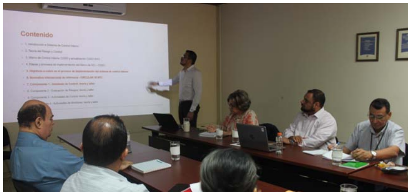
Capacitación Sistema de Control Interno con enfoque COSO