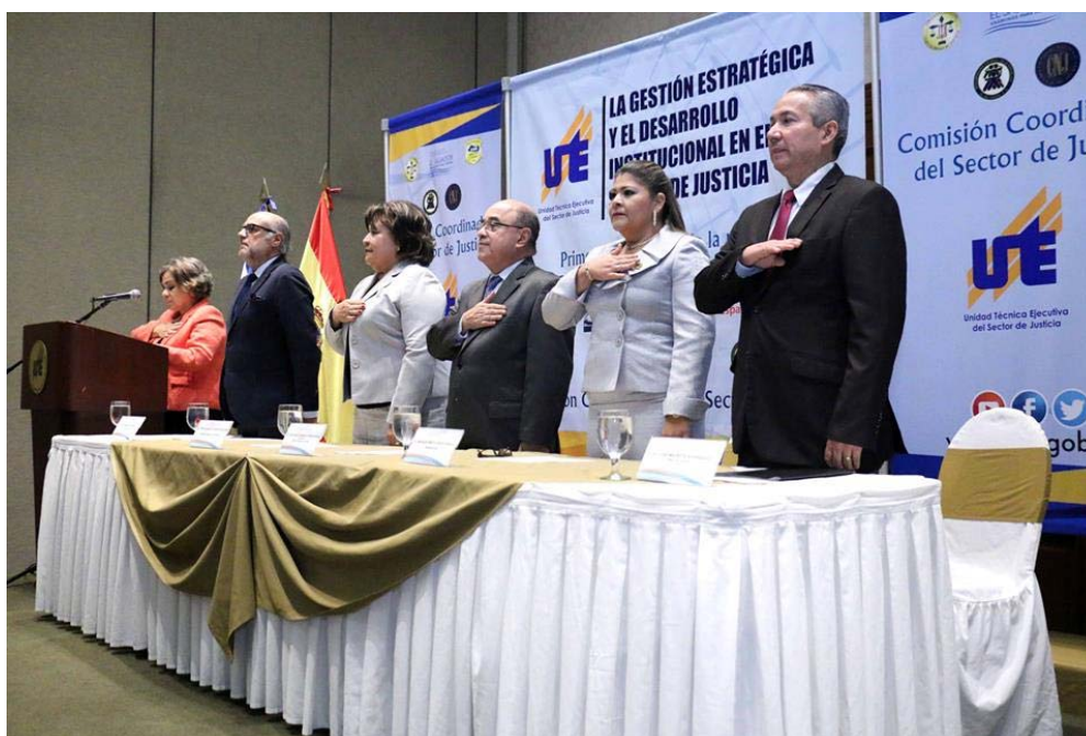
Evento divulgativo “La Gestión Estratégica y el Desarrollo Institucional en el Sector De Justicia” y Graduación de Primera Promoción de la Maestría en Gerencia Pública, Justicia y Seguridad.

En el marco de clausura de este proceso formativo fue desarrollado el evento divulgativo denominado “La Gestión Estratégica y el Desarrollo Institucional en el Sector De Justicia”.