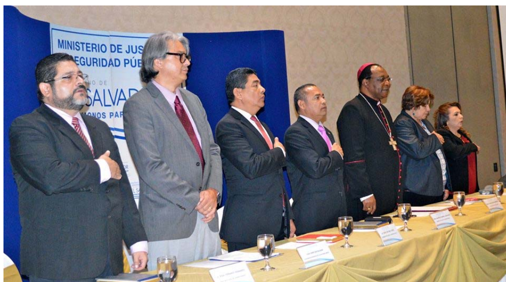
Evento “Logros y desafíos en la Humanización de los Centros de Privación de Libertad en El Salvador”