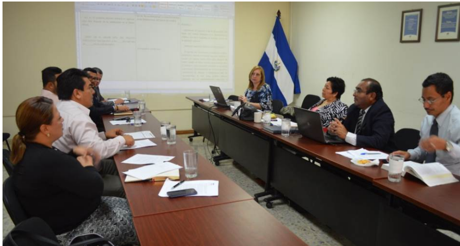
Mesa Especializada para el estudio de Expedientes Legislativos