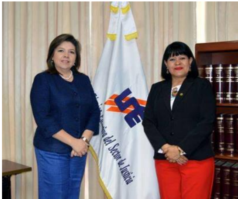
Directora General de la UTE y Ministra de Trabajo sostienen reunión para evaluar posibilidades de trabajo conjunto