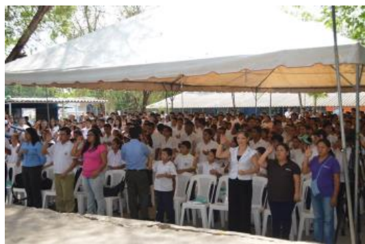
Evento de inauguración del Programa de Educación Legal Popular “La Justicia también es para mí”