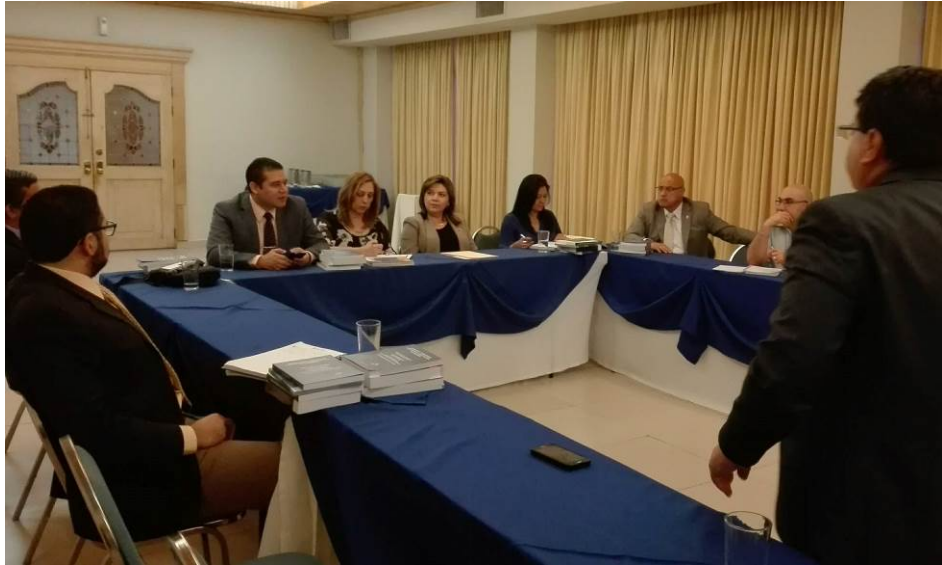
Taller sobre evaluación de la aplicación del Código Procesal Penal con Abogados independientes y principales Universidades.