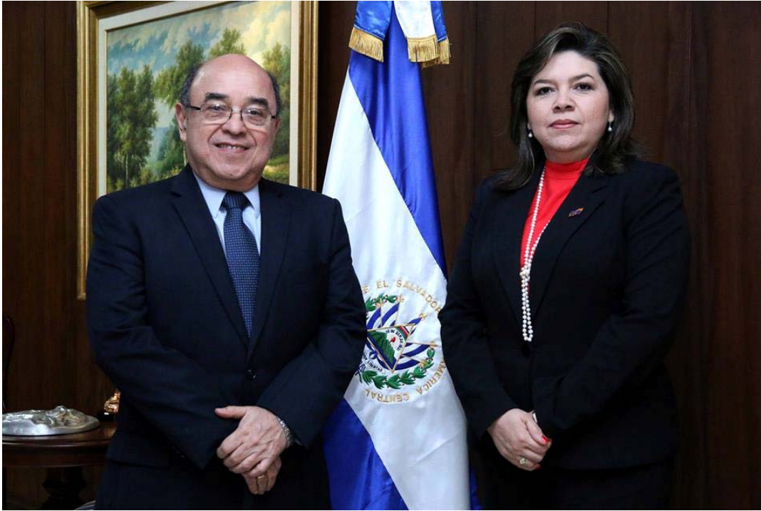
Presidente de la CSJ recibe a la nueva Directora General de la UTE y discuten proyectos sectoriales