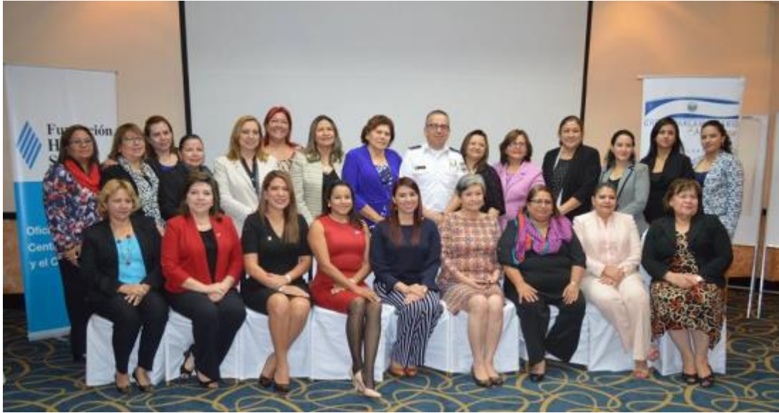
Directora General de la UTE participó en conversatorio sobre Tribunales Especializados para Mujeres.