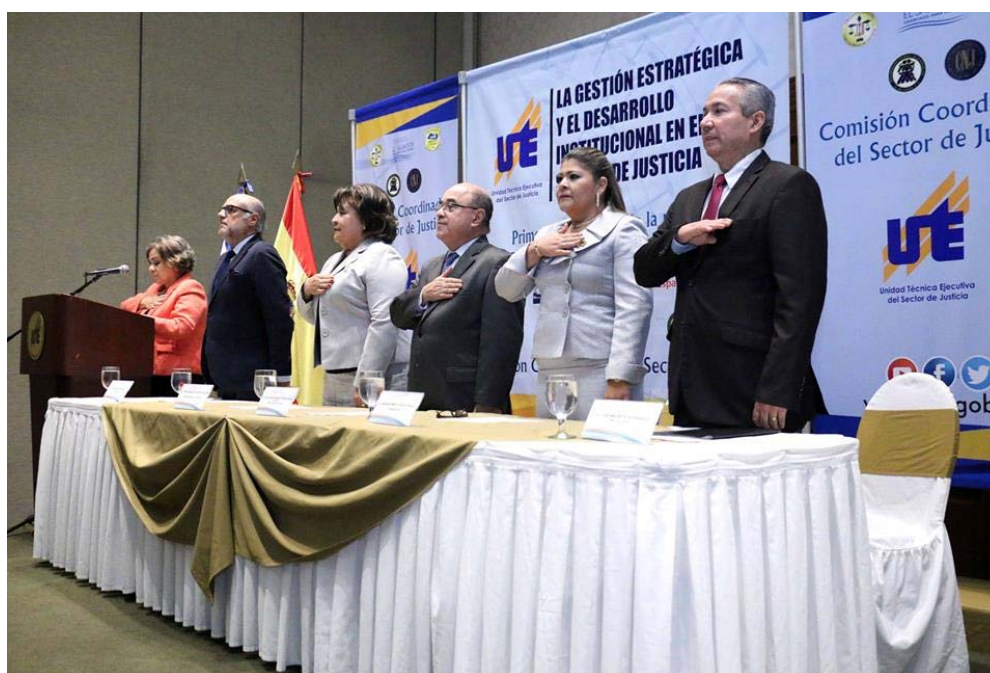
Evento divulgativo “La Gestión Estratégica y el Desarrollo Institucional en el Sector De Justicia” y Graduación de Primera Promoción de la Maestría en Gerencia Publica, Justicia y Seguridad.