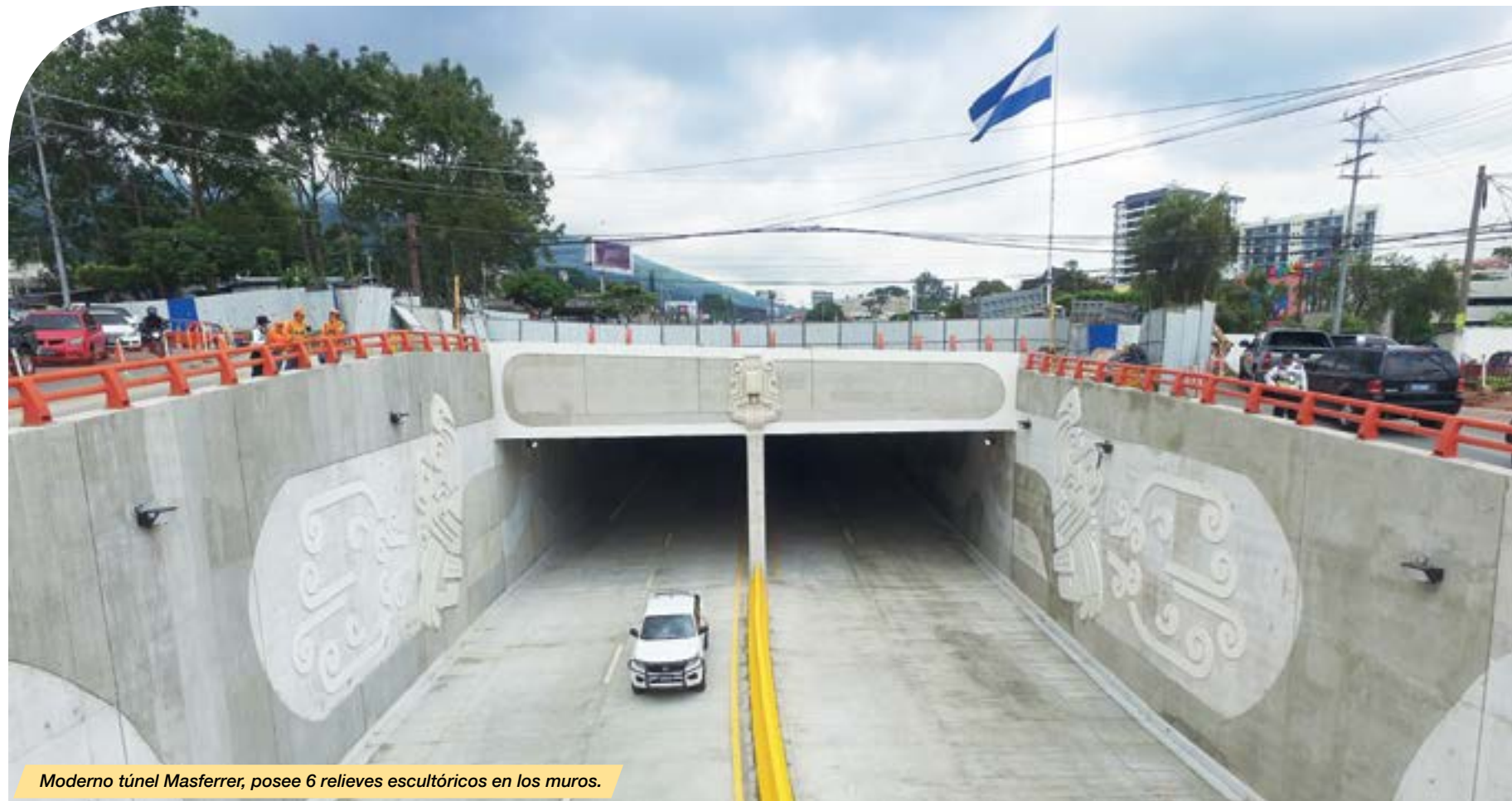
Moderno túnel Masferrer, posee 6 relieves escultóricos en los muros.