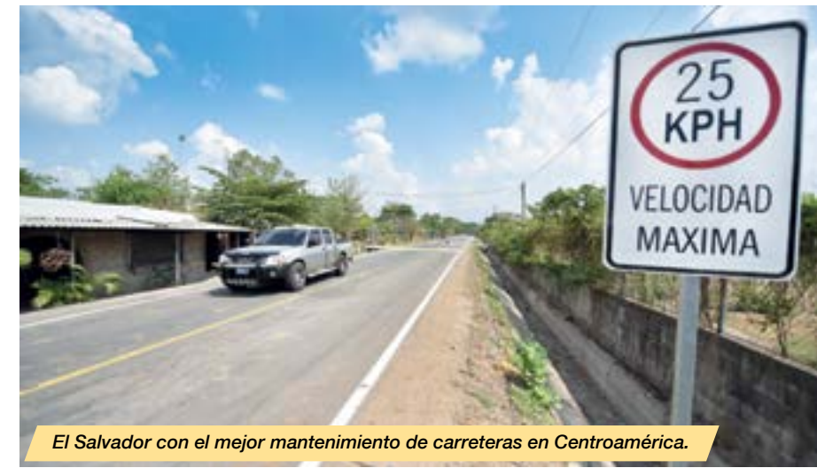
El Salvador con el mejor mantenimiento de carreteras en Centroamérica.