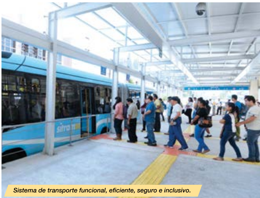
Sistema de transporte funcional, eficiente, seguro e inclusivo.