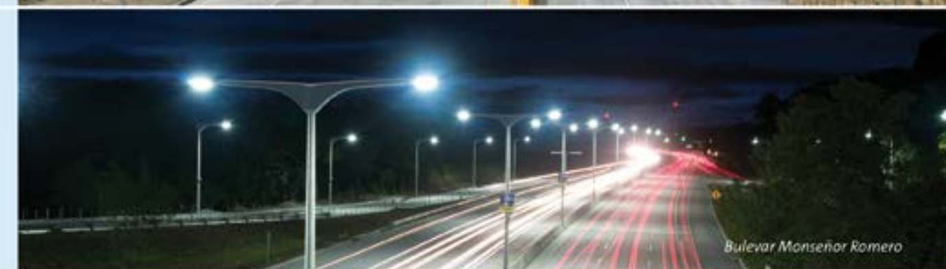
Bulevar Monseñor Romero

Excelente visibilidad y agarre al frenar