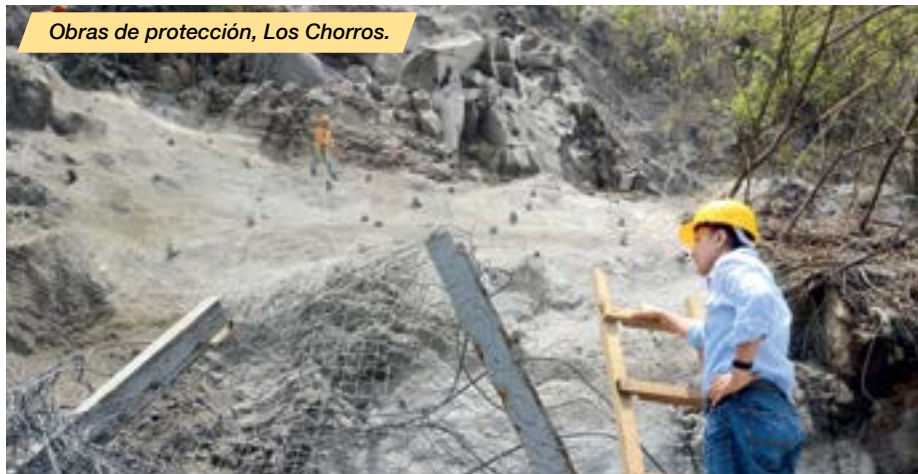
Obras de protección, Los Chorros.

• En un año 22 obras de protección en puntos vulnerables y con un acumulado de 758 cárcavas eliminadas.