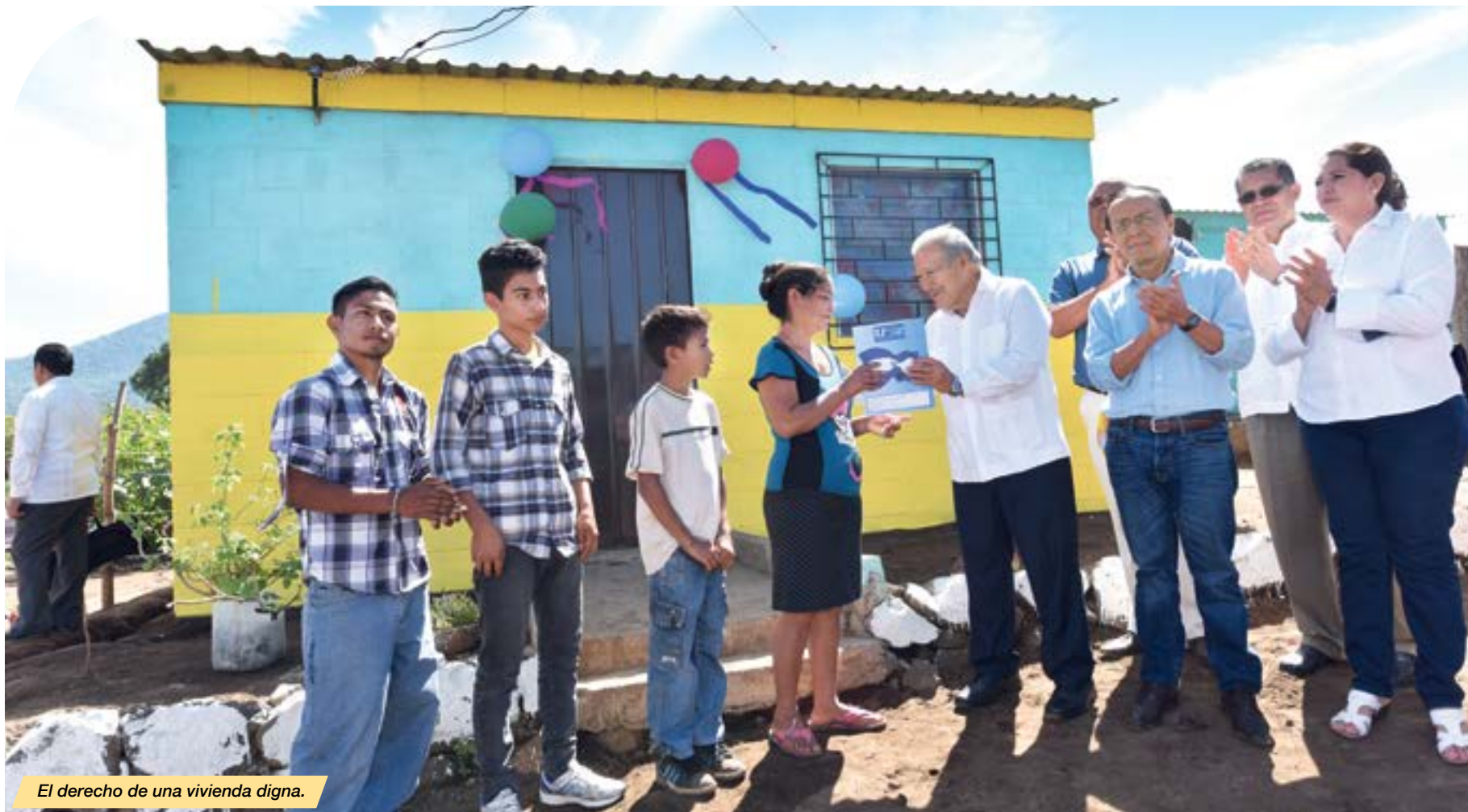
El derecho de una vivienda digna.