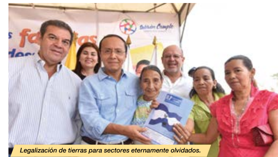
Legalización de tierras para sectores eternamente olvidados.