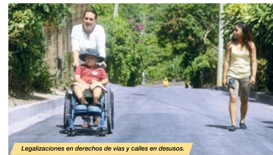
Legalizaciones en derechos de vías y calles en desusos.