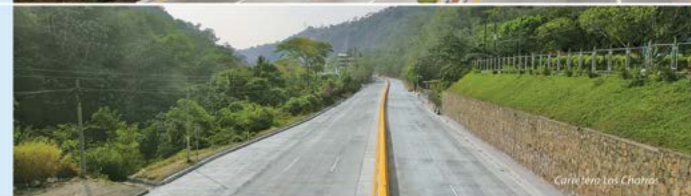
Carretera Los Chorrillos

Reducen las emisiones de CO2 y consumo de combustible