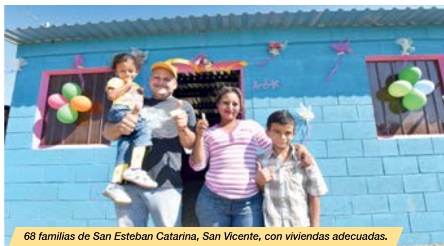
68 familias de San Esteban Catarina, San Vicente, con viviendas adecuadas.