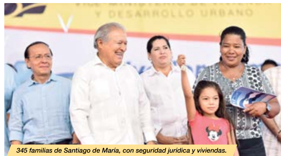
345 familias de Santiago de María, con seguridad jurídica y viviendas.