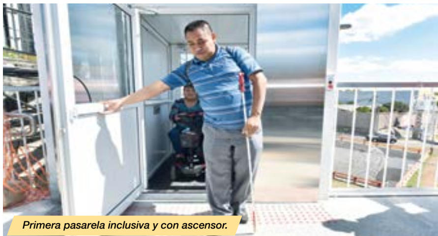
Primera pasarela inclusiva y con ascensor.

El nuevo puente en construcción es de 4 carriles de circulación vehicular de 3.65 metros cada uno (2 carriles más del existente), contará con aceras a ambos lados de 1.20 metros, barreras de protección vehicular y baranda peatonal. El ancho total es de 20.10 metros.