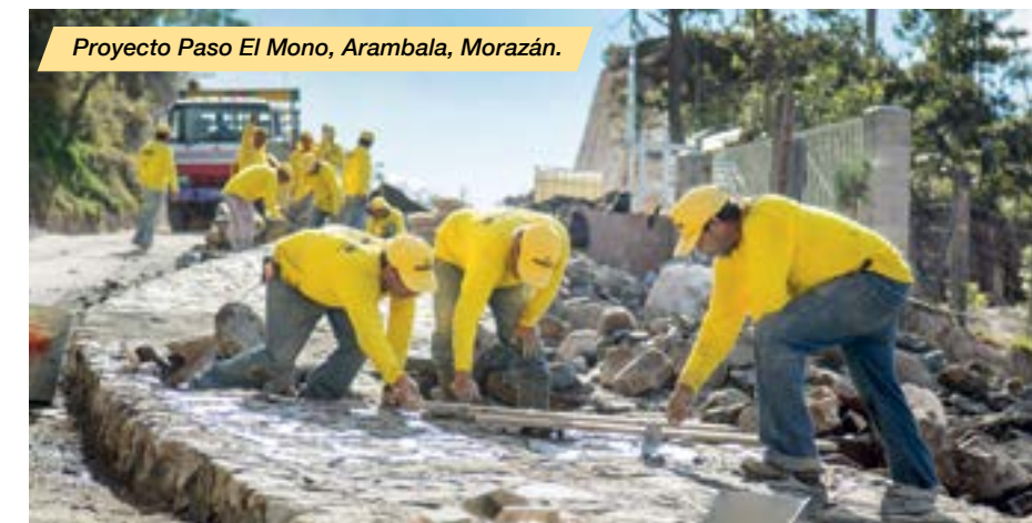
Proyecto Paso El Mono, Arambala, Morazán.