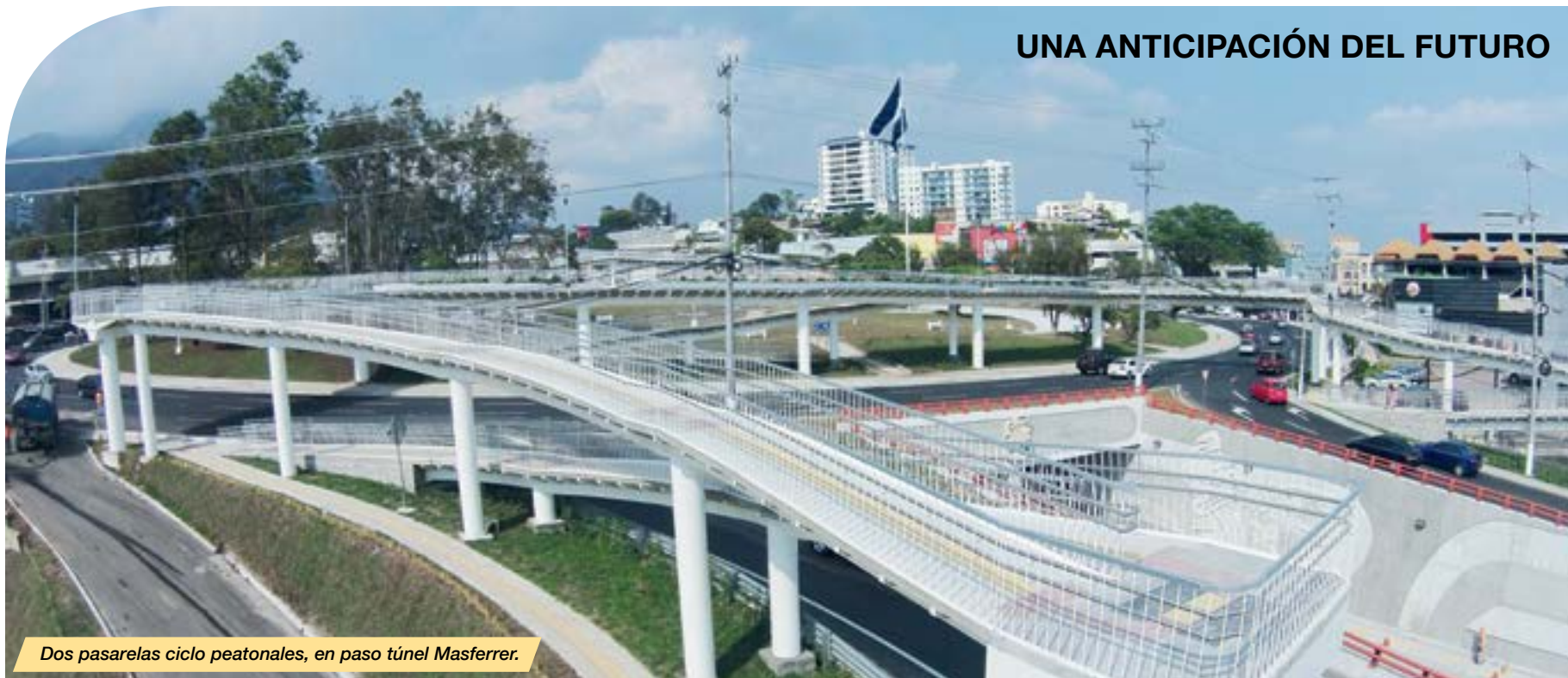
Dos pasarelas ciclo peatonales, en paso túnel Masferrer.

Esta política ha contribuido a que el sector privado de la construcción, en su mayoría, cumpla el Código de Ética y apoye la transparencia en la ejecución de los proyectos de obra pública.