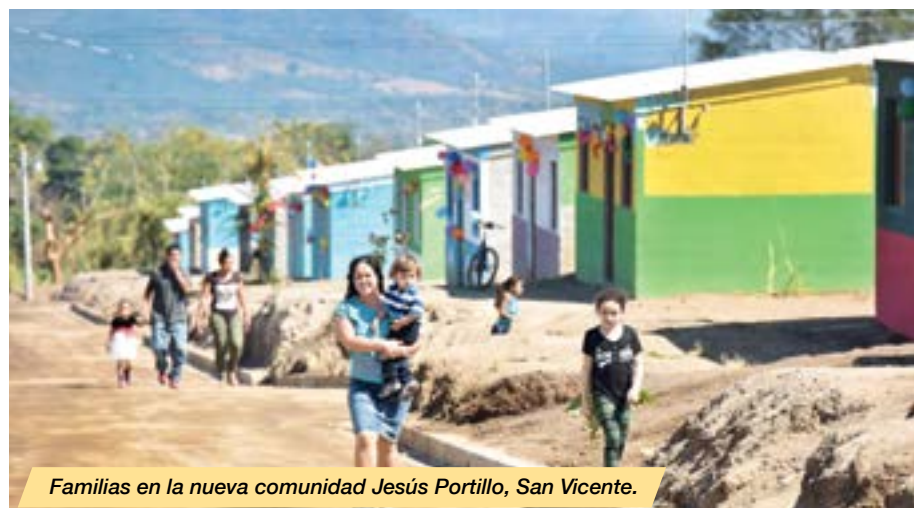
Familias en la nueva comunidad Jesús Portillo, San Vicente.