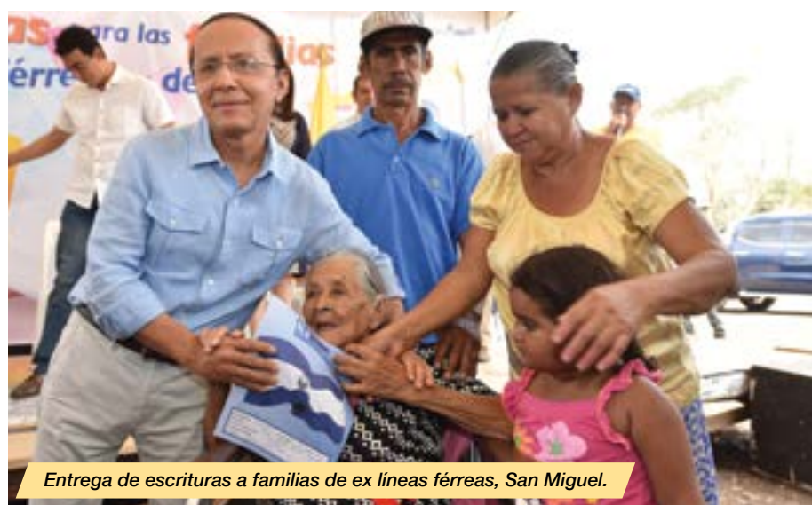
Entrega de escrituras a familias de ex líneas férreas, San Miguel.