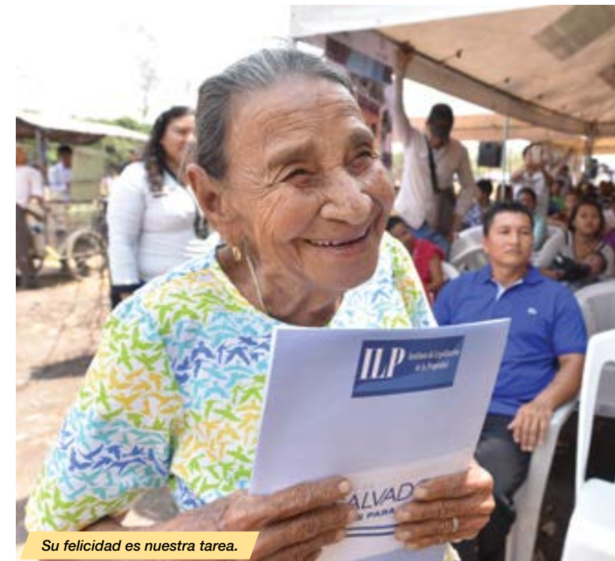
Su felicidad es nuestra tarea.