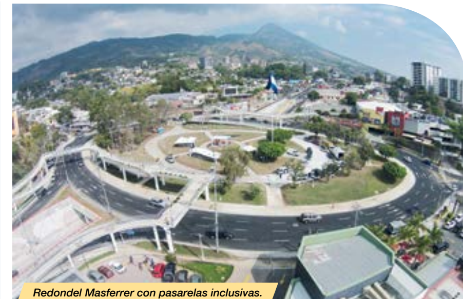
Redondel Masferrer con pasarelas inclusivas.

Desde entonces se trabaja en la construcción de ciclo rutas, canchas, zonas recreativas, la incorporación de circuitos inclusivos y de accesibilidad en importantes carreteras, plazas como: La Transparencia, Reconciliación que han sido construidas en derechos de vía del Bulevar Monseñor Romero, y otras obras de este tipo en espacios amigables con el medio ambiente, forman parte de este esfuerzo que se realiza.