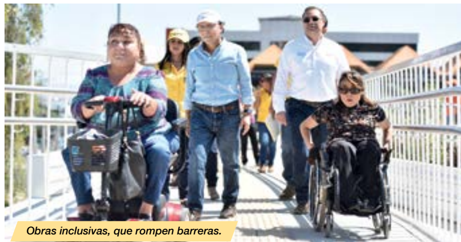
Obras inclusivas, que rompen barreras.

Por este puente se moviliza un tráfico promedio diario de 3,080 vehículos, de estos 809 es transporte de carga. Posee un importante rol estratégico para el comercio y la integración con la región, ya que a través de este se mueve más del 20% de la mercadería operada en los pasos fronterizos.