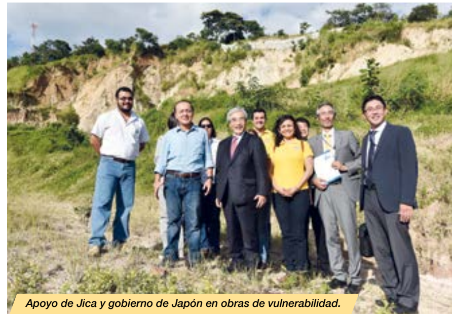
Apoyo de Jica y gobierno de Japón en obras de vulnerabilidad.

Una inversión de $1,152.58 millones , en cooperaciones reembolsables y no reembolsables (donaciones). De esta cartera se encuentra en ejecución $639.44 millones , en gestión avanzada de financiamiento $210.36 millones y en inicio de gestión para financiamiento $302.78 millones , distribuidas en los tres viceministerios así: 71% para el VMOP, 14% para el Vmvdv y un 15% al VMT.