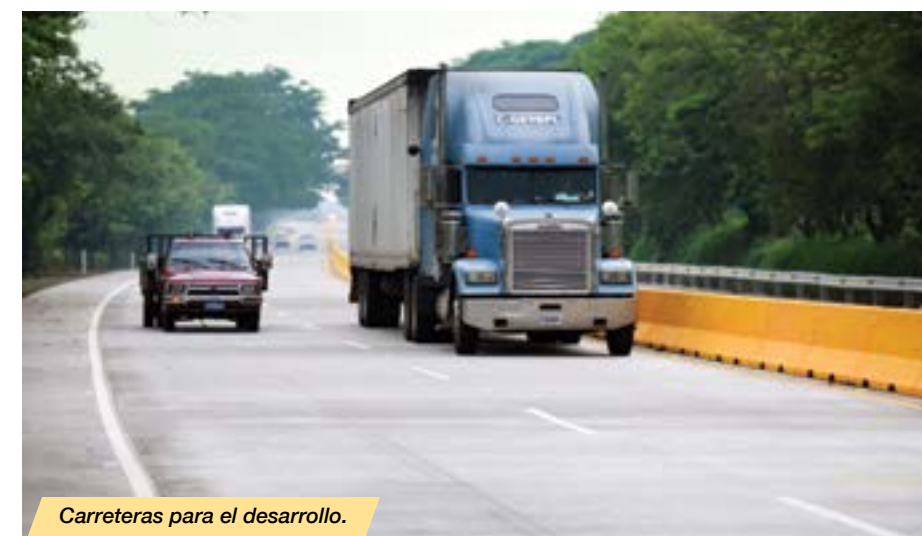
Carreteras para el desarrollo.