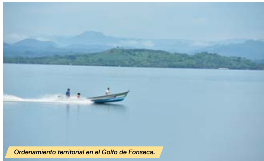
Ordenamiento territorial en el Golfo de Fonseca.

El MOP ha ganado la confianza de la ciudadanía, el sector privado, la cooperación internacional y los organismos multilaterales. Alcanzó niveles óptimos de trabajo conjunto con instancias de toda la sociedad salvadoreña y de la comunidad internacional, lo que permitió mayor apoyo financiero para proyectos de desarrollo de infraestructura en la historia reciente de El Salvador gracias a la orientación de su política de cooperación.