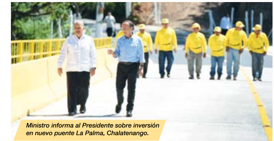
Ministro informa al Presidente sobre inversión en nuevo puente La Palma, Chalatenango.

Del 2014 al 2017, el MOP y Fovial ejecutaron 1,435 obras viales, con una inversión de $1,199 millones.