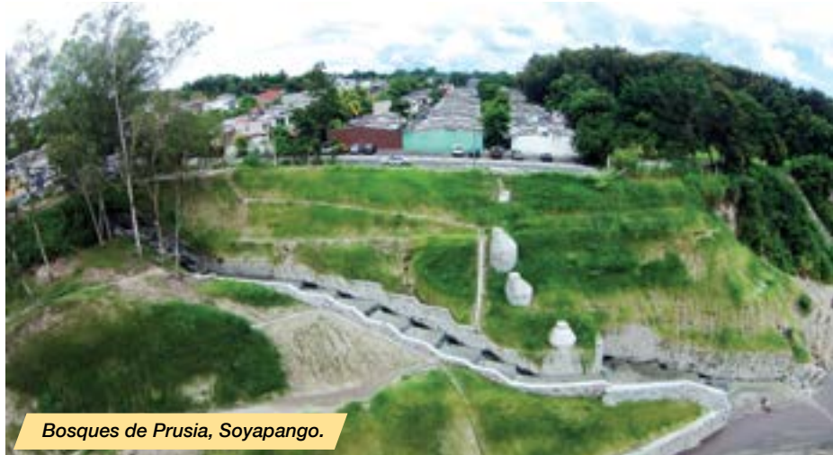
Bosques de Prusia, Soyapango.