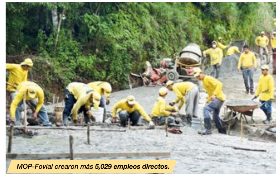
MOP-Fovial crearon más 5,029 empleos directos.

La inversión del MOP, FOVIAL, y la del Sector Vivienda, hacen un total de $340.14 millones, entre el 2016 y 2017.