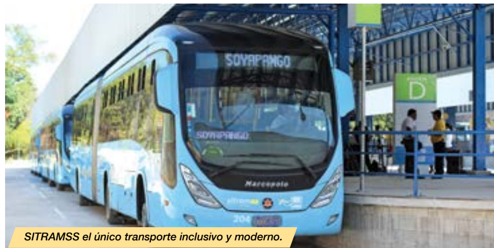
SITRAMSS el único transporte inclusivo y moderno.

De junio de 2016 a mayo de 2017, el MOP junto a sus tres viceministerios y el Fovial, ejecutaron 382 obras por inversión y administración, a un monto de $228.23 millones , que incluyen carreteras, caminos rurales, obras de protección, puentes y obras de paso, señalización, mantenimiento y construcción de viviendas, soluciones habitacionales, obras para el Sistema Integrado de Transporte del Área Metropolitana de San Salvador (Sitramss), entre otras.