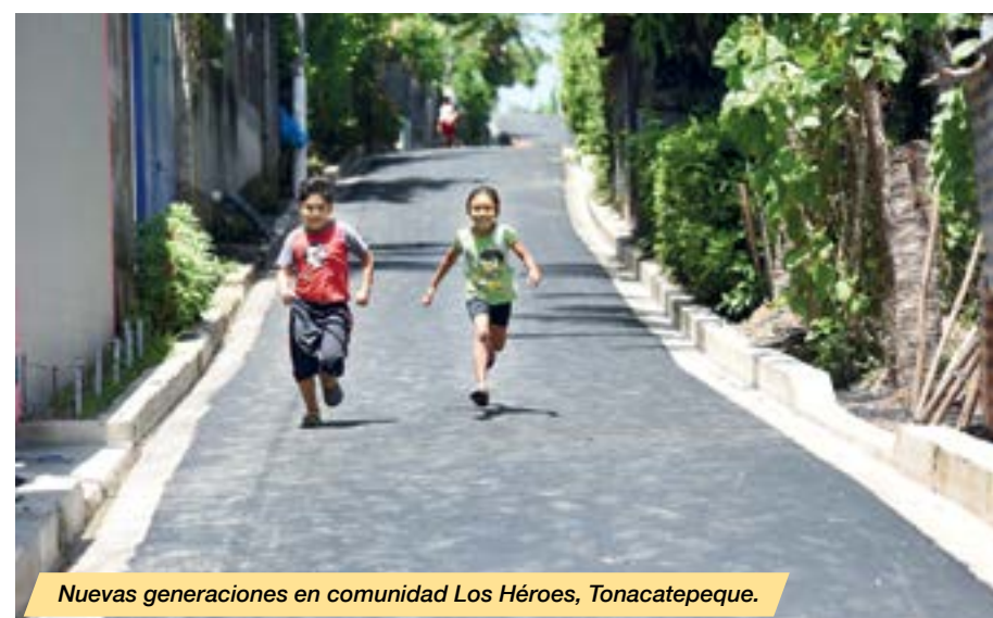
Nuevas generaciones en comunidad Los Héroes, Tonacatepeque.

La inversión del Sector incluye: construcción de pisos, infraestructura complementaria de servicios básicos y vías de circulación en asentamientos urbanos precarios, en la regularización y legalización de lotes de viviendas, con lo que se ha logrado impactar en los dos déficit habitacionales, cuantitativo y cualitativo.