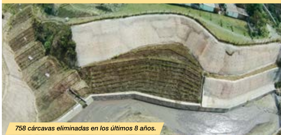
758 cárcavas eliminadas en los últimos 8 años.