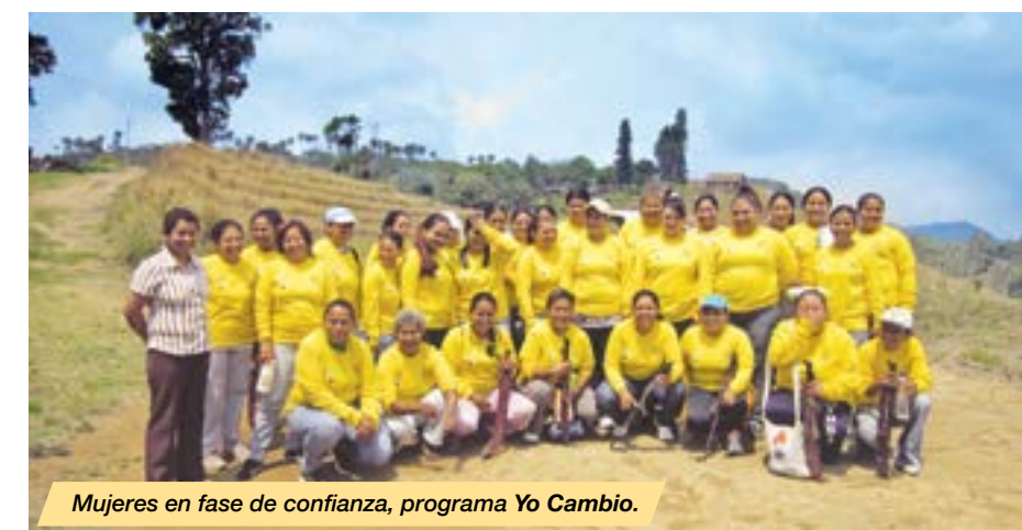
Mujeres en fase de confianza, programa Yo Cambio.