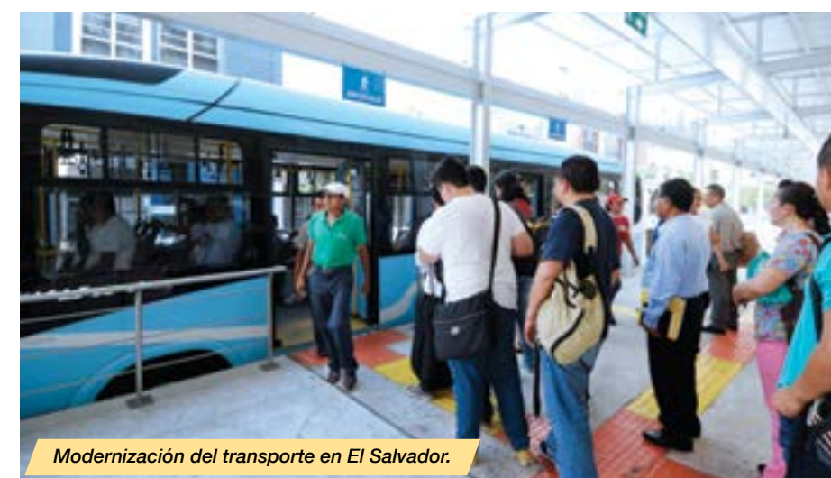
Modernización del transporte en El Salvador.