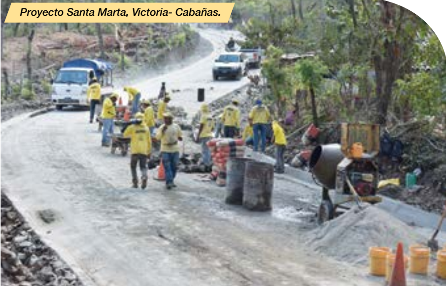
Proyecto Santa Marta, Victoria- Cabañas.

En el periodo examinado, logró la integración de 40 personas en proceso de rehabilitación a labores de reforestación en proyectos como: Mejora paisajística en carril auxiliar en Bulevar Monseñor Romero, obras de paisajismo y sistema de riego en Plaza Costa Rica, Obras complementarias de esculturas, senderización y paisajismo en Plaza a La Reconciliación.