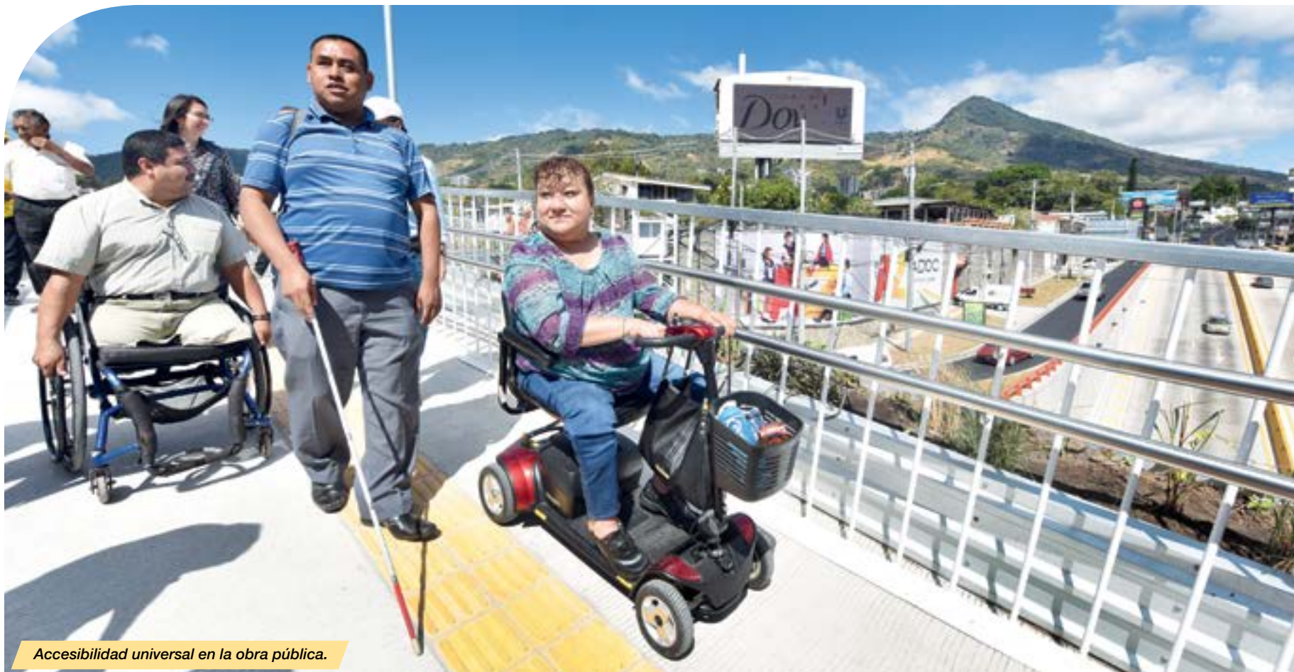
Accesibilidad universal en la obra pública.