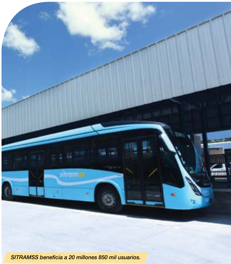
SITRAMSS beneficia a 20 millones 850 mil usuarios.