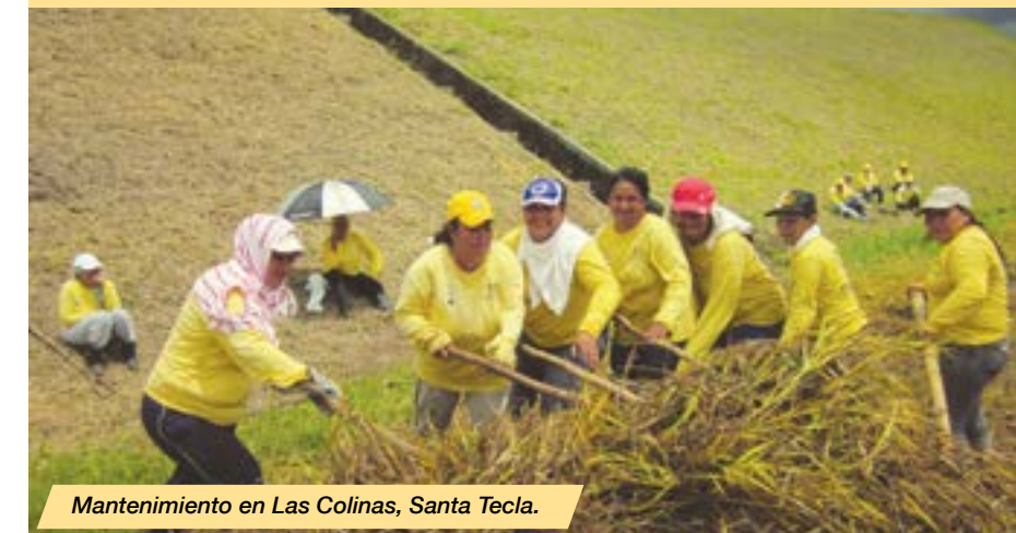
Mantenimiento en Las Colinas, Santa Tecla.