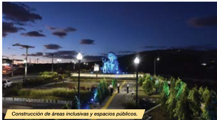
Construcción de áreas inclusivas y espacios públicos.

El sector vivienda gubernamental, integrado por el Fondo Social para la Vivienda (FSV), Fondo Nacional para Vivienda Popular (Fonavipo), Instituto para la Legalización de la Propiedad (ILP), y el Viceministerio de Vivienda y Desarrollo Urbano (VMVDU) , en su conjunto beneficiaron a 83,534 salvadoreños, o sea 22,761 familias, con una inversión de $147.87 millones , mediante la facilitación del acceso a vivienda a través de créditos, contribuciones y la construcción de vivienda.