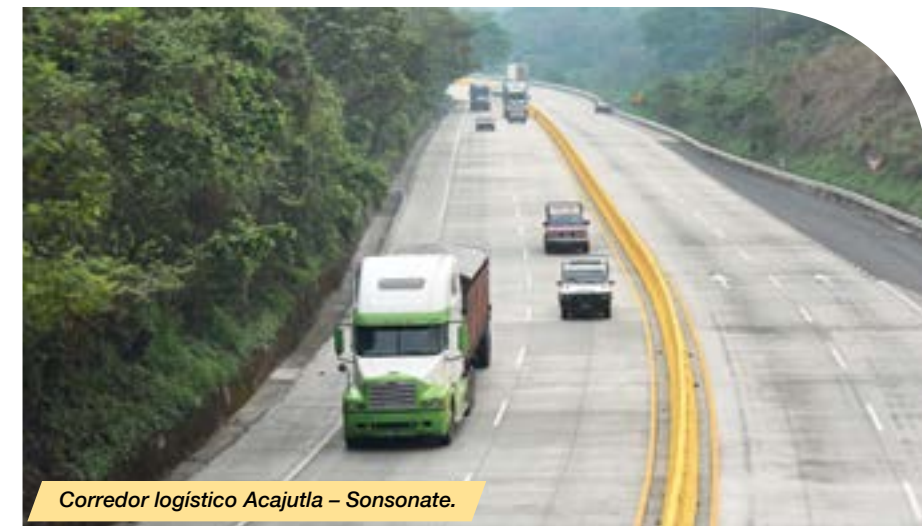
Corredor logístico Acajutla – Sonsonate.

El documento finalizado se remitió a la Secretaría Técnica y de Planificación de la Presidencia para su validación final, y actualmente se encuentra en la fase de edición, diagramación e impresión del documento final.