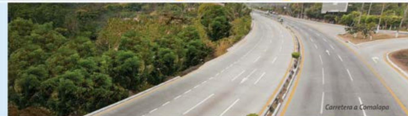
Carretera a Comalapa

Resistentes a la lluvias y formación de baches