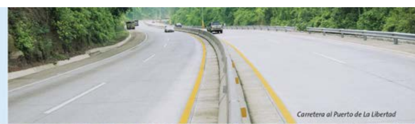
Carretera al Puerto de La Libertad

Construidas con productos nacionales, con mínimo de costo de mantenimiento