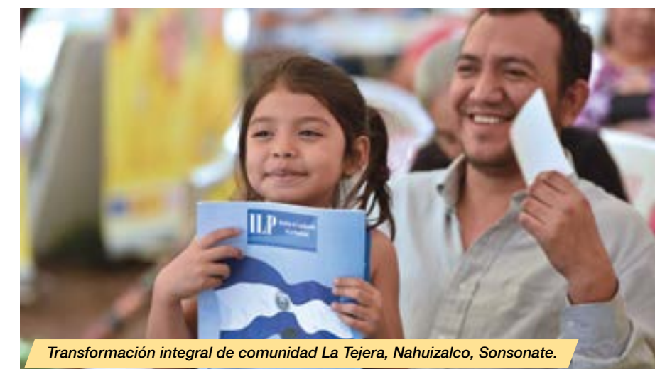
Transformación integral de comunidad La Tejera, Nahuizalco, Sonsonate.