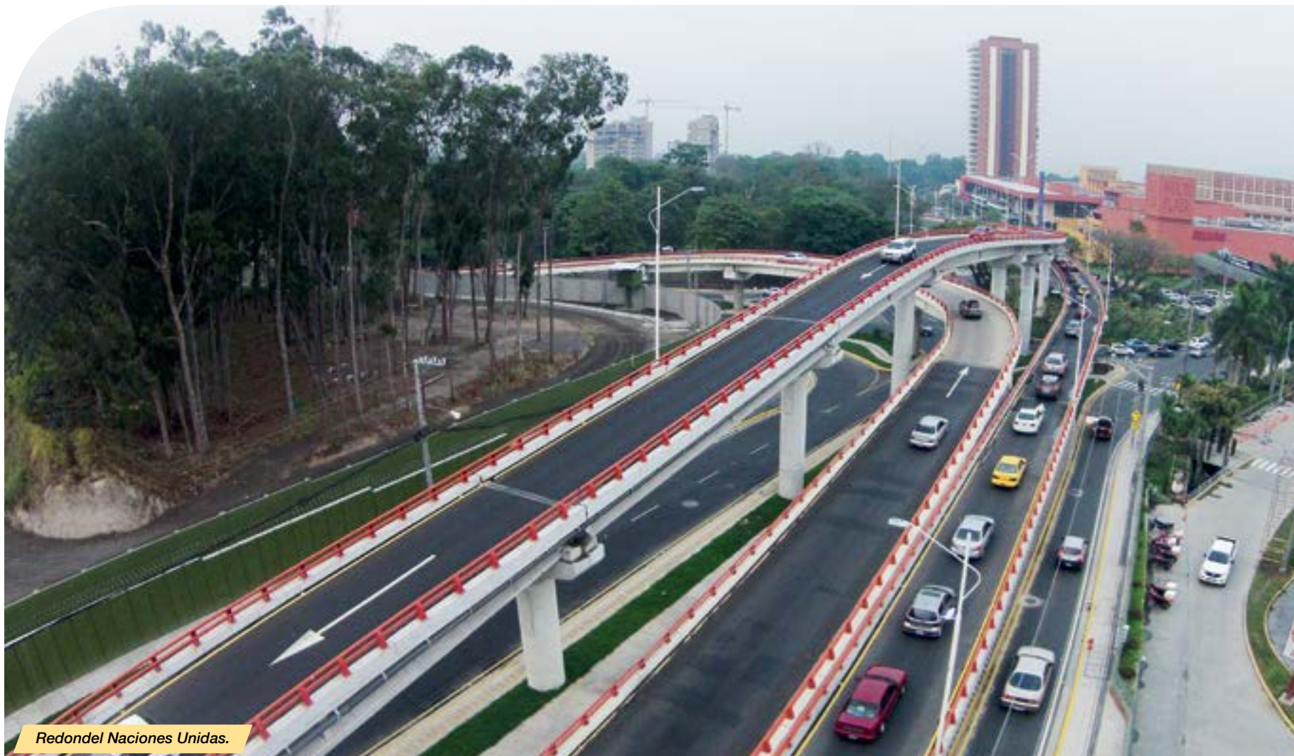
Redondel Naciones Unidas.