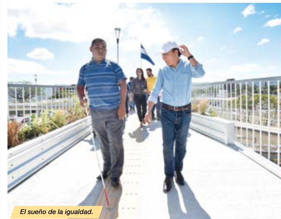
El sueño de la igualdad.