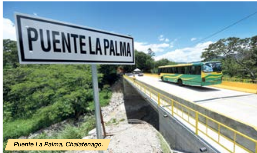
Puente La Palma, Chalatenago.

En los tres años 2014–2017, se han realizado importantes esfuerzos en las áreas de cooperación y gestión de fondos externos e internos, a efecto de gestionar la obtención de financiamiento para la realización de obras y actividades en pro de la sustentabilidad ambiental, los cuales ascienden aproximadamente a $57.9 millones , de los que $7.8 millones corresponden a donaciones financieras, $6.06 a donaciones en especies y $44 millones a préstamo externo.