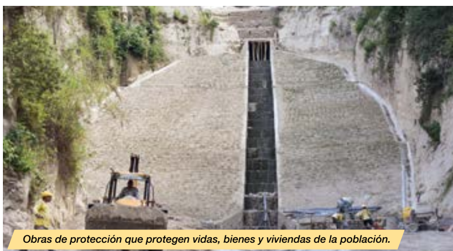
Obras de protección que protegen vidas, bienes y viviendas de la población.

Asimismo, no se registra ningún proceso por negar información pública a los ciudadanos ni a medios de comunicación, una muestra de los niveles alcanzados con eficiencia, ética, transparencia, que eleva al país en el concierto internacional a un honroso nivel en la administración de proyectos de infraestructura pública.