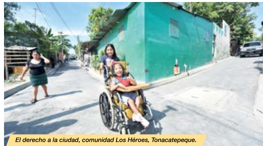
El derecho a la ciudad, comunidad Los Héroes, Tonacatepeque.