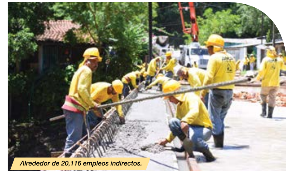
Alrededor de 20,116 empleos indirectos.

De estos 771.14 kilómetros, 46.7 son nuevas carreteras; 514 sometidos a rehabilitación, 174.11 mejorados con mantenimiento; y 0.9 kilómetros en puentes y obras de paso. Estos kilómetros incluyen el rescate de 25.97 km con material reciclado por Fovial; y 443.27 kilómetros construidos por el MOP en apoyo a las municipalidades.