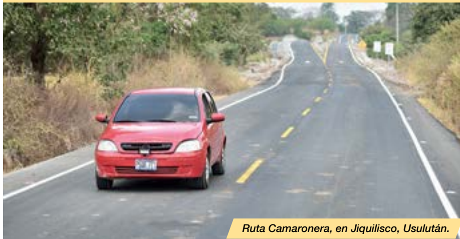
Ruta Camaronera, en Jiquilisco, Usulután.

Entre las nuevas carreteras construidas en este periodo se encuentran: pavimentación de 7.36 kilómetros de la Ruta Camaronera, en Tierra Blanca-Cantón San Hilario-sitio El Corral-Salinas El Zompopero, Jiquilisco, Usulután, proyecto que ha venido a mejorar la transitabilidad en la carretera El Litoral y la Bahía de Jiquilisco; carretera tramo: Victoria-desvío El Zapote-Caserío Santa Marta, Cabañas, de 4.9 km de longitud; carretera Tramo Cantón Tejera-Paso El Mono-Arambala, Morazán, de 12.5 kilómetros, y otros, que han generado cientos de empleos y desarrollo local.