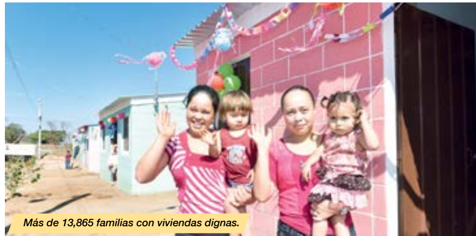
Más de 13,865 familias con viviendas dignas.