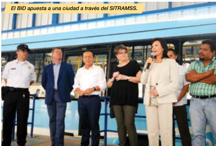
El BID apuesta a una ciudad a través del SITRAMSS.