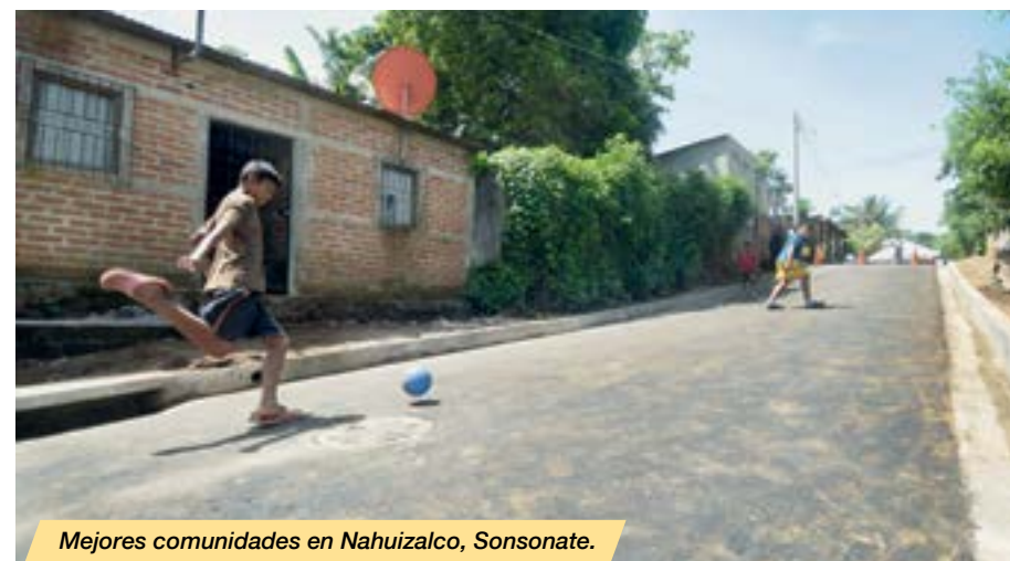
Mejores comunidades en Nahuizalco, Sonsonate.