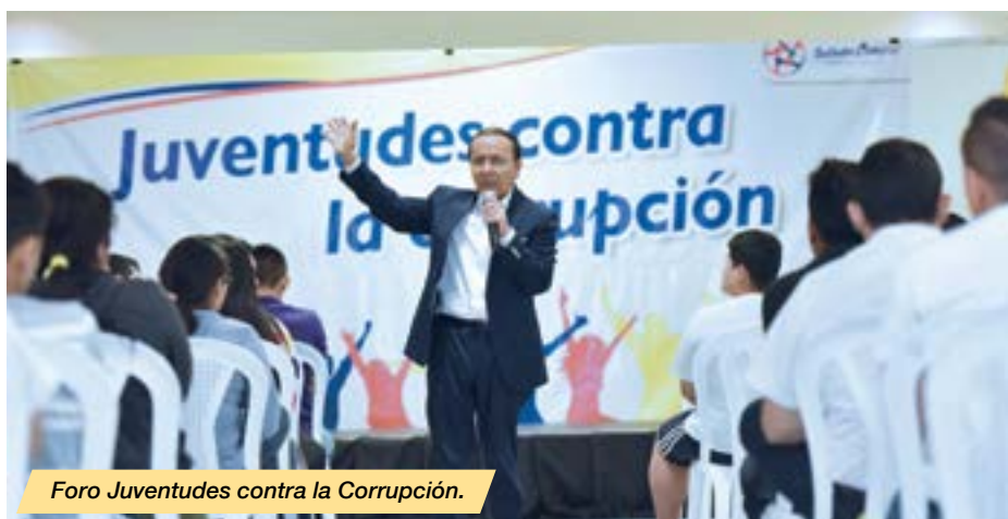
Foro Juventudes contra la Corrupción.