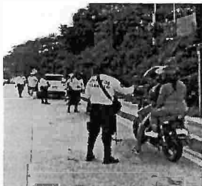
Km 27 carretera al Puerto de La Libertad