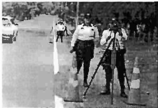
Carretera Panamericana km 41 Ciudad Arce