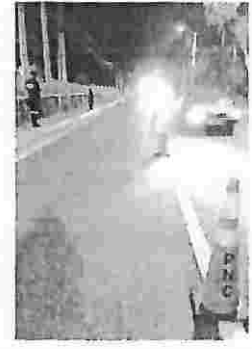
Autopista a Comalapa altura de banco BAC credomatic