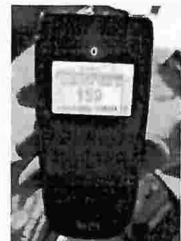
Dispositivo Antidoping Carr. al puerto de la Libertad frente al Centro Comercial La Joya (sentido al Puerto)