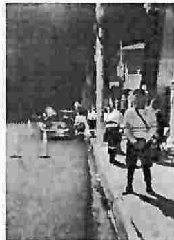
Antidoping sobre la 5a AV. Norte frente a la iglesia luz del mundo