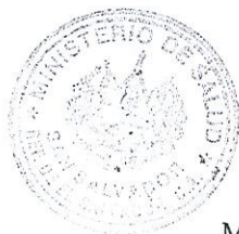
MARIA ISABEL RODRIGUEZ MINISTRA