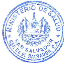
MARÍA ISABEL RODRÍGUEZ VDA. DE SUTTER MINISTRA DE SALUD