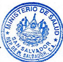
MARÍA ISABEL RODRÍGUEZ VDA. DE SUTTER MINISTRA DE SALUD

Las notificaciones entre las partes deberán hacerse por escrito y tendrán efecto a partir de la fecha de su recepción en las direcciones que a continuación se indican: EL MINSAL en: Calle Arce Número Ochocientos Veintisiete, San Salvador, y LA CONTRATISTA en: Calle Arturo Ambrogi, número nueve, entre ciento uno y ciento tres avenida Norte, Colonia Escalón, Sa, Salvador, Tel. 2252-5418. En fe de lo cual firmamos el presente Contrato en la ciudad de San Salvador, a los tres días del mes de abril de dos mil catorce.