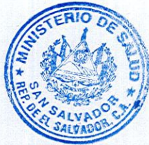
MARÍA ISABEL RODRÍGUEZ VDA. DE SUTTER MINISTRA DE SALUD