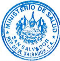
MARÍA ISABEL RODRÍGUEZ VDA. DE SUTTER MINISTRA DE SALUD