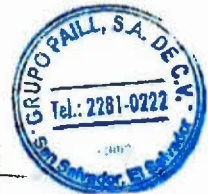
"GRUPO PAILL, S.A. DE C.V." "CONTRATISTA"