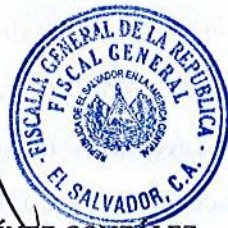
LUIS ANTONIO MARTÍNEZ GONZÁLEZ FISCAL GENERAL DE LA REPÚBLICA