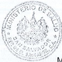
MARIA ISABEL RODRIGUEZ MINISTRA