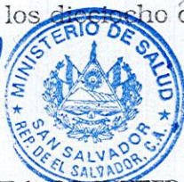
MARÍA ISABEL RODRÍGUEZ VDA. DE SUTTER MINISTRA DE SALUD