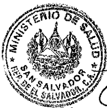
DRA. ELVIA VIOLETA MENJIVAR ESCALANTE MINISTRA DE SALUD

EL MINSAL señala como lugar para recibir notificaciones la dirección: Calle Arce, Número ochocientos veintisiete, San Salvador y LA CONTRATISTA señala para el mismo efecto la siguiente dirección: Treinta y Siete Calle Oriente, Número Trescientos Sesenta y Cinco y Pasaje YSI, Colonia La Rábida, San Salvador, Teléfono 2235-2851, 2235-3851 y 2225-2307. Correo Electrónico: farlab@navegante.com.sv. farlab2@navegante.com.sv. y farlab@farlab.com.sv. Todas las comunicaciones o notificaciones referentes a la ejecución de este Contrato serán válidas solamente cuando sean hechas por escrito a las direcciones que las partes señalamos para tal efecto. En fe de lo cual suscribimos el presente Contrato, en la ciudad de San Salvador, a los treinta días del mes de enero de dos mil dieciocho.