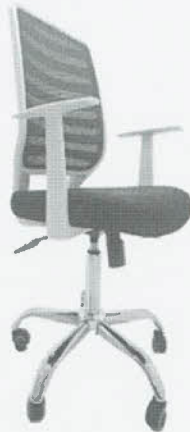
Imagen de carácter ilustrativo dobles

SILLA ERGONÓMICA SEMIEJECUTIVA CON BRAZOS (320). CÓDIGO SINAB: 62502035