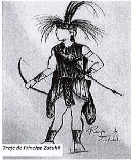
Traje de Principe Zutuhil