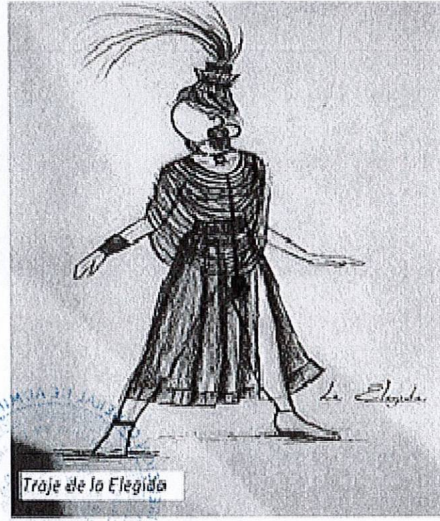
Traje de la Elegida