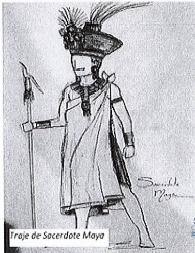
Traje de Sacerdote Maya