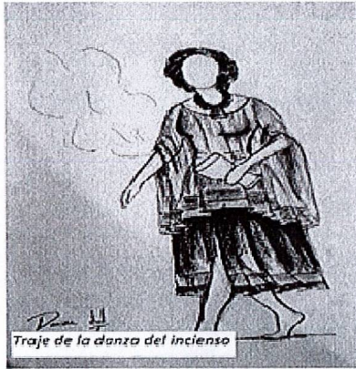
Traje de la danza del incienso