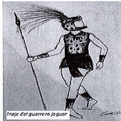
Traje del guerreo jaguar