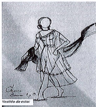
Vestido de esta