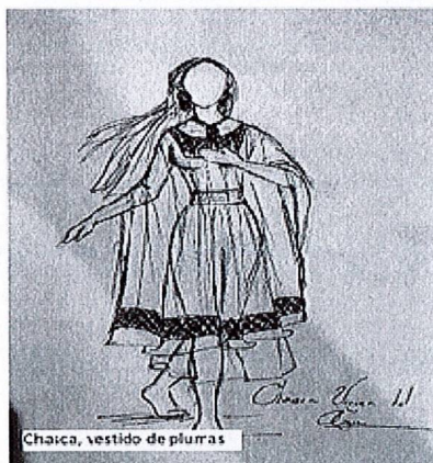
Chaica, vestido de plumas