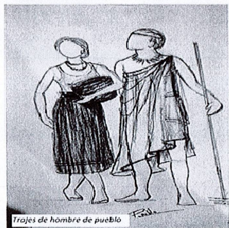
Trajes de hombre de pueblo