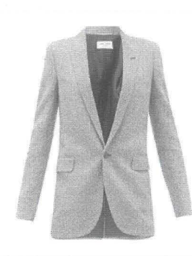
foto del diseño de los blazer femenino y masculino. la diferencia entre ellos es la pinza que lleva el blazer femenino detallado en las especificaciones técnicas.