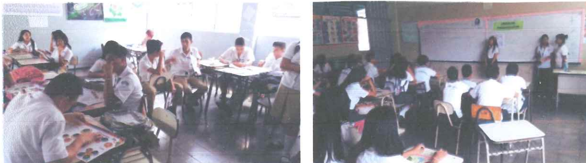
Figura 15: Docentes en taller de autocuidado y convivencia escolar