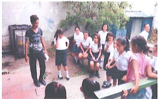
Recreo Dirigido Realizado por Gobierno Estudiantil.