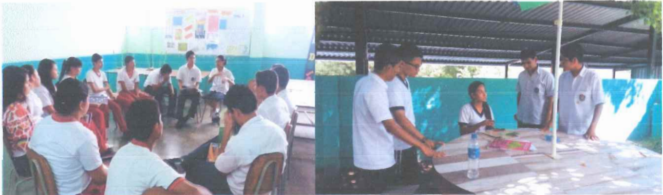
Figura 13: Fotografía en Complejo Educativo Católico Fe y Alegría San José, estudiantes en recreo dirigido, organizado por Comité de Convivencia y docentes de primer ciclo.