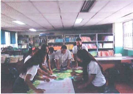
Elaboración de Murales de la Convivencia