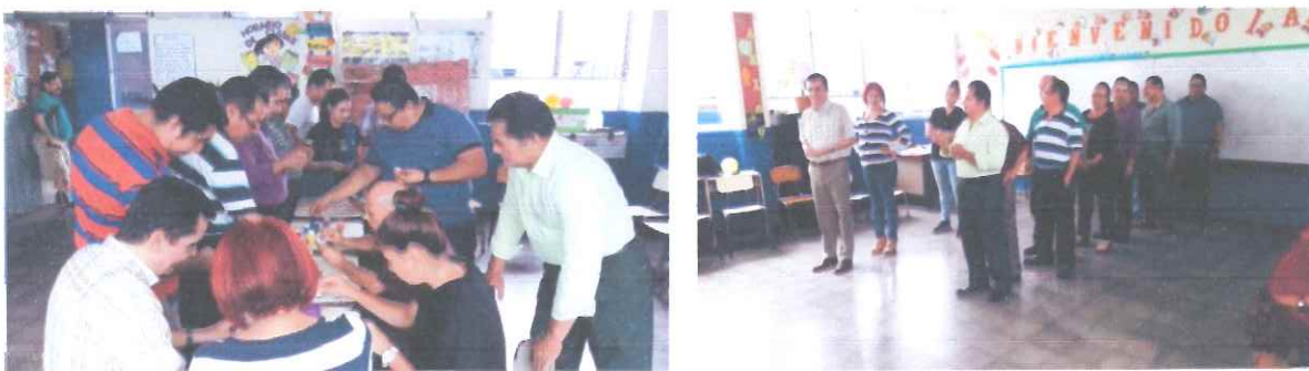
Figura 16: Madres y padres de familia participan en jornada de educación familiar con el tema mis compromisos como madres