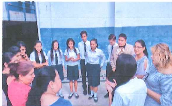
Rol Playing sobre roles de género dirigido por Gobierno estudiantil