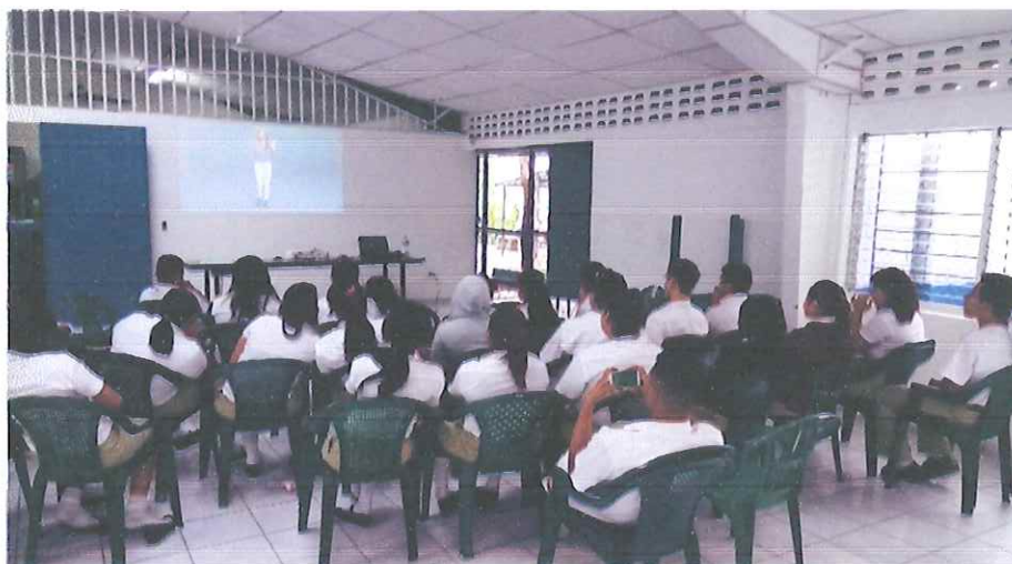
Figura 2: Foto que da a conocer el proceso de sensibilización sobre el tema de prevención de violencia de género con estudiantes del Comité de convivencia del Instituto Nacional de Comercio.