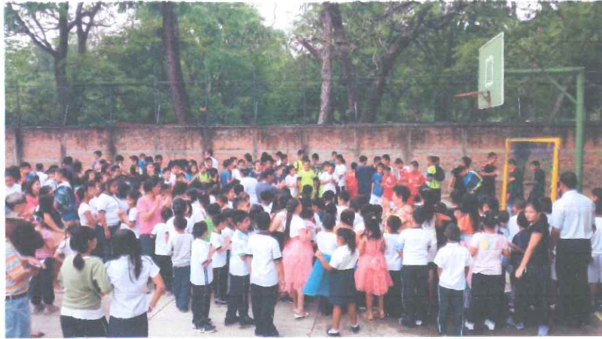
Figura 10: Fiesta cívica – Fortalecimiento de valores y liderazgo transformativo en Centro educativo República de Uruguay