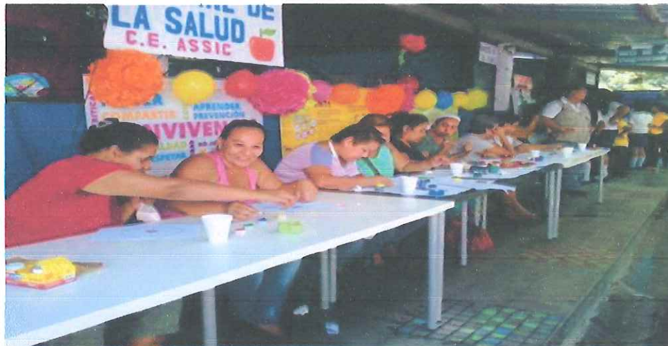
Figura 4: C.E. Asociación de Señoras de Ingenieros Civiles, del municipio de Mejicanos: Fotografía que refleja la multiplicación de replicas realizadas por estudiantes del Comité de Convivencia del C.E.